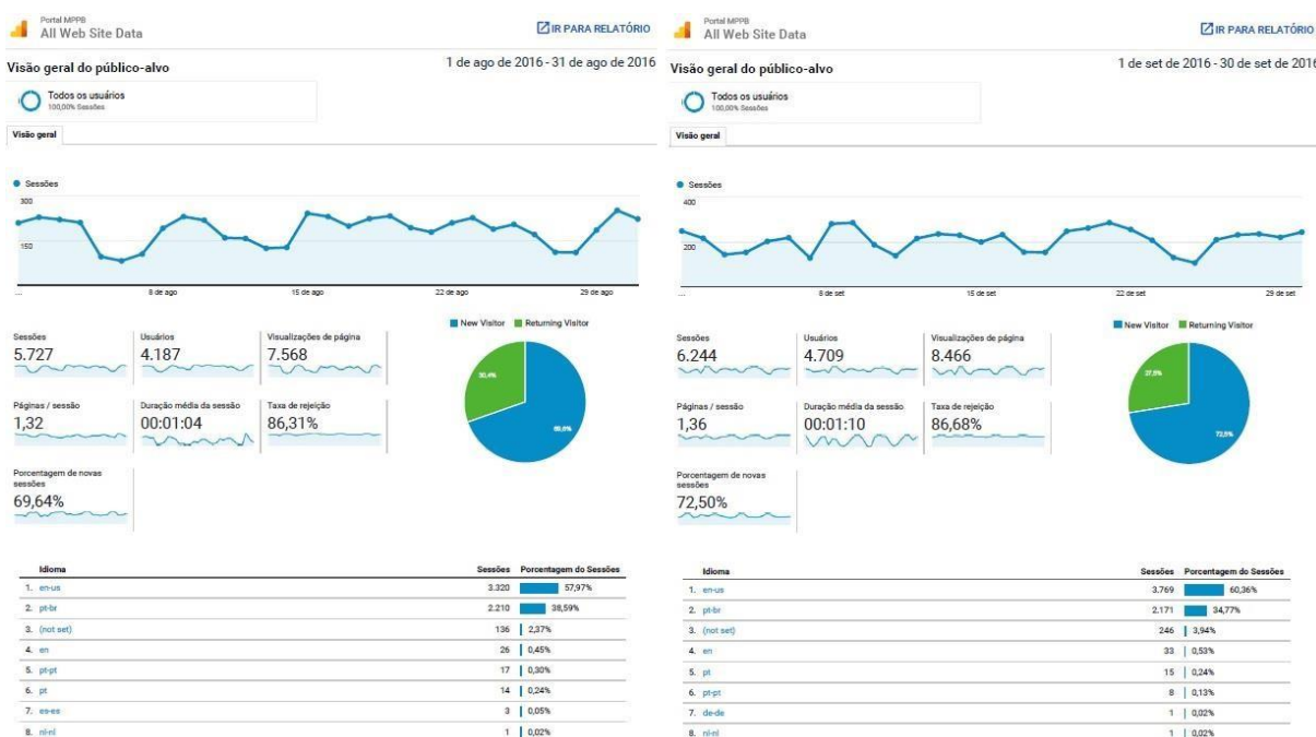
Figura 3 – Relatórios do Google Analytics , Visão Geral do público-alvo dos meses agosto e setembro 2016

Através do gráfico percebe-se que no mês de agosto/16 ocorreu um pico de acesso próximo ao fim do mês, apresentando 5.727 acessos de 4.187 usuários, sendo que desse quantitativo de acessos, 30,4% retornaram ao site e 69,6% foram novas visitas registradas. Analisando o mês de setembro/16, constata-se que ocorreram mais acessos em relação a agosto/16, totalizando 6.244 sessões iniciadas por 4.709 usuários, representando 72,5% de novas visitas ao site e 27,5% retornaram o acesso ao site no mesmo mês.