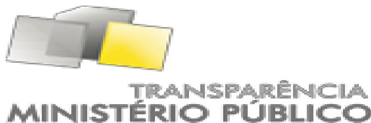
Figura 1 – Logomarca padrão dos Ministérios Públicos do Brasil

Sua identidade visual é padrão em todos os Ministérios públicos no Brasil, estando em posição de destaque no site institucional de cada um, conforme segue: