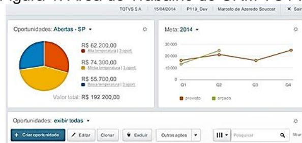
Figura 1: Área de Trabalho do CRM TOTVS

O CRM TOTVS® permite que o gerente acompanhe em tempo real, todo o processo ligado ao cliente, desde suas últimas vendas até o conhecimento do perfil do cliente em relação a compra do produtos da empresa (JAYACHANDRAN, 2005) e (MITHAS et al., 2005). E possibilita a sincronização da proposta em oportunidade, não necessitando de controles paralelos. Outro recurso é a facilidade de mostrar na tela apenas as informações e gráficos mais relevantes, por meio de um painel, conforme mostra figura 1