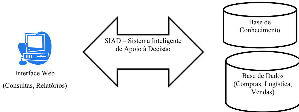
Figura 1: Arquitetura do SIAD implementado.

mercado, no que diz respeito à lucratividade e volume de vendas para os gerentes comerciais e diretores. O segundo passo, é a visualização de sugestões de decisões que poderão ser tomadas a partir dos dados analisados. Esta análise é realizada pelo SIAD proposto, por meio da aplicação de técnicas de IA. Optou-se pela implementação de um Sistema Especialista, baseado em regras de produção, como técnica de IA para o SIAD. A Figura 1 apresenta a arquitetura do SIAD implementado.