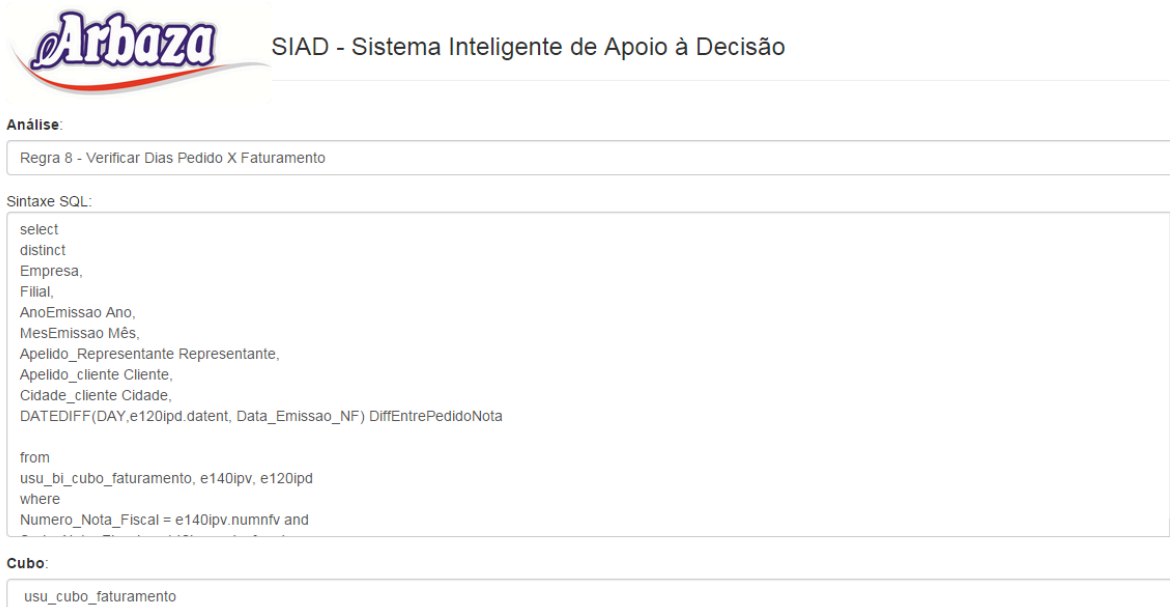
Figura 4: Análise Verificar dias pedido X faturamento

A figura 4 mostra o cadastro de uma nova análise. No exemplo consta uma análise denominada Verificar Dias Pedido X Faturamento, a qual tem finalidade de mostrar quantos dias cada pedido está demorando a se transformar em nota fiscal e ser despachado para os Clientes. Este cadastro é realizado pelo desenvolvedor do SIAD, por meio da criação de uma consulta SQL, com base nas regras definidas pelo especialista do domínio.