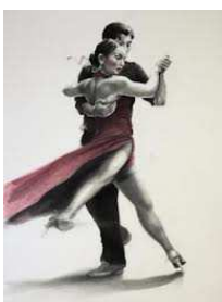
Figura 16: Giro (molinete)

Uma figura do Tango na qual a mulher dança em torno do homem, dando um passo ao lado, um passo atrás, um passo ao lado e um passo à frente, enquanto o homem executa pivôs no centro da figura. Esta é uma técnica muito comum no tango que desafia tanto o homem quanto a mulher a manter uma boa postura, equilíbrio e técnica, a fim de realizá-la bem.