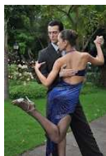
Figura 6: Boleo

O Boleo é feito pela mulher, a partir de um corte rápido no sentido da dança, com um oito para trás. Um Boleo pode ser feito com o dedo do pé rasante ao soalho ou alteado, assim diz-se Boleo Alto ou Baixo. Para se fazer esse passo, os joelhos devem estar juntos, sentir a intenção do homem em cortar o passo e deixar livremente o pé balançar (mas sempre pelo chão). Neste adorno existe a sensação de chicote. No Boleo Alto, o pé só levanta quando chega ao final do percurso, senão, pode ser perigoso para outros pares que estejam a dançar.