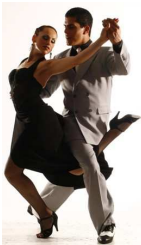
Figura 12: Gancho

Surge quando um dançarino engancha o seu pé em torno da perna do parceiro, flexionando o joelho e libertando-o. Pode ser efetuado por qualquer perna e pelo homem ou mulher.