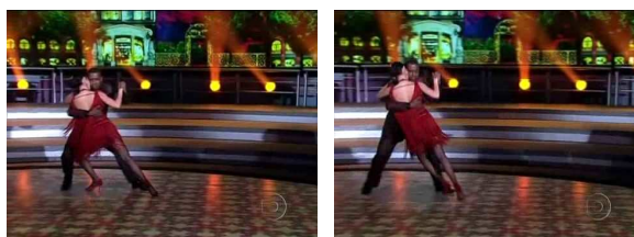
Figura 4 - Passos e gestos

Devido aos seus simbolismos e, por ser uma dança sensual e insinuante enfrentou diversos tipos de preconceitos devido à sua difusão nos prostíbulos portenhos. Uma das incoerências dispensadas a ele era o abraço, passo básico que consta de uma entrada na dança. Sendo o desenvolvimento que é a parte andada, o meio que é feito por um cruze e o fechamento representado pela resolução natural.