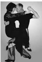
Figura 13: Sentada

Uma figura, onde a ação é semelhante a de sentar-se.