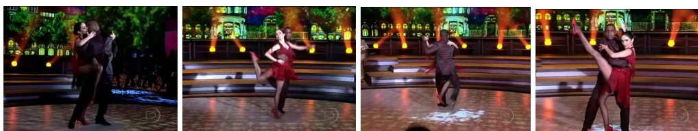
Figura 20 - Jogo da conquista e sedução

Na dança, a produção gestual da bailarina o seduz, os passos como o gancho , enrosque , boleo , carícias , sentada entre outros, representam e consomem a conquista. Esses passos têm uma ligação muito forte com a parte pélvica, que torna a dança mais sensual. Na música, ele tenta fugir, e não consegue. E assim a coreografia é moldada e encenada no jogo da conquista e sedução.