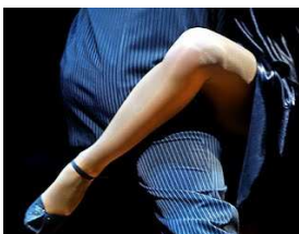
Figura 8: Enrosque

A dama enrosca sua perna em volta do cavalheiro ou de sua perna.