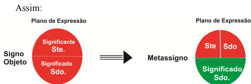
Figura 1 - Composição do metassigno

[...] uma propriedade essencial do signo é a de poder comportar-se tanto como signo-objeto - quando substituí, por assim dizer, o 'objeto' do qual esse signo é signo -, quando poder comportar-se como meta-signo - quando substituí não já um 'objeto', diretamente, mas, sim, outros signos.