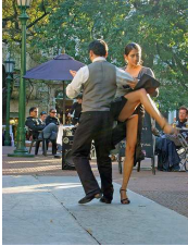
Figura 10: Firulete

Movimentos complicados ou sincopados que o dançarino usa para demonstrar a sua habilidade a interpretar a música.