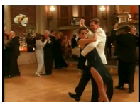
Figura 5: Arrastre

Arrastando o pé do seu par, durante uma caminhada ou volta.