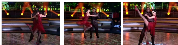
Figura 2 - A dança e as roupas

curtas com fendas ou franjas, blusas e vestidos sempre com decotes marcantes, sensuais e insinuantes.