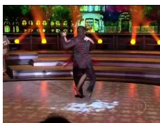
Figura 18 - Passo gancho

Entendemos também como categoria sensualidade VS não sensualidade que gera o sentido no nível fundamental e se manifesta no conjunto dos elementos que constituem a dança: a rosa, o movimento de pernas, a música, o olhar, o toque, os gestos etc. O gesto sozinho, isolado, não tem sentido algum. Por exemplo, o passo gancho sozinho, totalmente descontextualizado, fora do tango, não tem sentido. A figura a seguir, ilustra o passo gancho.