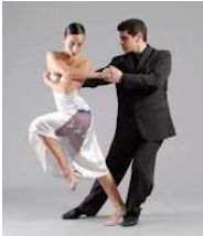
Figura 11: Colgada

Uma figura do Tango, em que o cavalheiro deixa sua dama fora do eixo, mantendo-a distante do seu abraço.