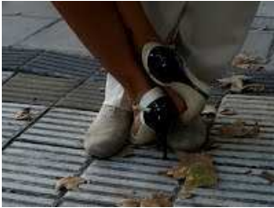
Figura 9: Sanduíche (sanguchito)

O homem trava o pé esquerdo da mulher entre os seus pés.