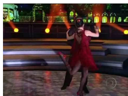
Figura 19 - O sentido da dança

Como vimos no referencial teórico sobre práxis, para termos uma práxis completa, é necessário que haja a junção de todos os elementos como: as roupas, os acessórios, os passos, os gestos, os olhares, a música etc, para se criar o sentido da dança tango. Ou seja, a dança constitui-se pela junção da práxis prática e da gestualidade mítica, para gerar a comunicação gestual. Sem esses elementos, não temos uma práxis, ou seja, não há como ter um entendimento da dança sem eles. É a organização do plano de conteúdo e do plano de expressão.