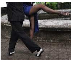
Figura 14: Sacada

Uma figura do Tango, onde o cavalheiro produz o efeito de "sacar" (tirar) o pé da dama do lugar. Vale lembrar que o cavalheiro também pode conduzir a dama para receber uma sacada executada por ela.