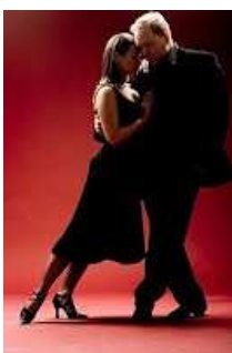
Figura 15: Volcada

Uma figura do Tango, em que o cavalheiro deixa sua dama fora do eixo, mantendo-a apoiada próximo ao seu abraço.