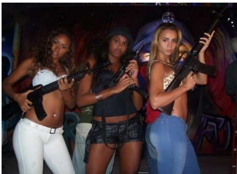
Figura 3 - Baile funk e apologia às armas.

Abaixo, uma imagem que ilustra a relação entre o baile funk e o mundo da contravenção, da valorização do porte de armas: