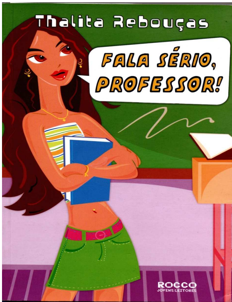
Figura 3 - Capa

A capa do livro é chamativa, com cores fortes e desenho para que possa chamar a atenção do público jovem.