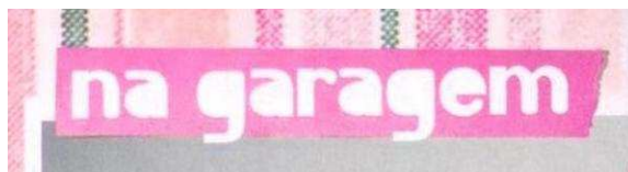
Figura 15 – Título da seção Na garagem Fonte: REVISTA ATREVIDA, maio 2010, p. 47.