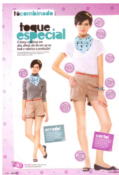
Figura 12 – Toque especial Fonte: REVISTA ATREVIDA, maio 2010, p. 44.

Na seção “tá combinado”, a revista traz um acessório de vestuário e o modo correto de se usar de acordo com a moda do momento, ou seja, divulga-se o objeto da moda para influenciar o modo de se vestir das adolescentes.