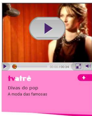
Figura 2 – Vídeos TV Atrê

A figura abaixo apresenta a “TV Atrê”, veiculada pela revista online , cuja apresentação, intitulada “Divas do pop”, é composta por modelos que se vestem e são maquiadas conforme as cantoras do universo artístico. Assim, as leitoras podem acompanhar a TV passo a passo para ficarem parecidas com essas cantoras.