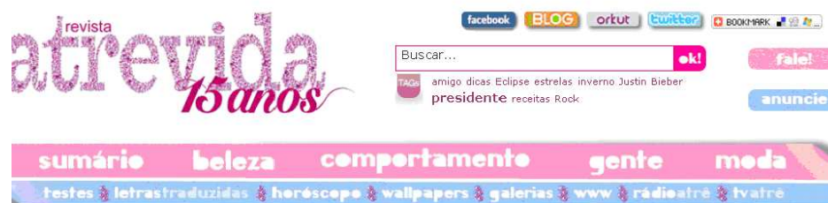
Figura 1 – Recursos na versão online