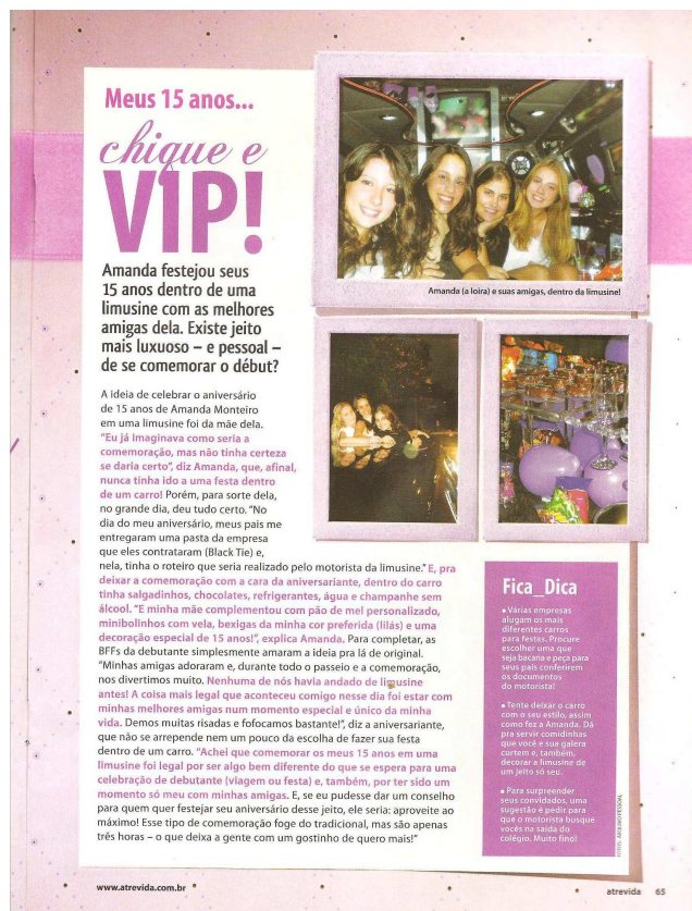
Figura 7 – Meus 15 anos

As leitoras também podem participar na criação de seções da revista. Atualmente, troca-se a “carta do leitor” pelo e-mail , porém o objetivo de divulgar e colocar em discussão a opinião do leitor foi mantido, embora haja, hoje, rapidez na troca de mensagens, inclusive sem precisar sair de casa.