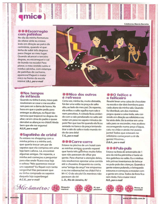
Figura 8 – Quadro Q Mico

Nessa seção, as leitoras escrevem suas gafes, mas não é possível saber se isso aconteceu exatamente com elas, por isso o anonimato, cujo objetivo é não expor aos outros a identidade no “Q mico” da revista Atrevida . Assim, como a única identificação são as iniciais dos nomes, apenas uma delas enviou também o nome da cidade onde mora, Rio de Janeiro, que pode ter sido inventado pela leitora para que se dispersem as possibilidades de saber de onde ela realmente é.