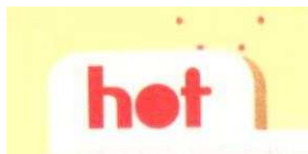
Figura 13 – Título da seção Hot

Outros recursos linguísticos utilizados na revista são os títulos das seções escritos em letras minúsculas e com formato arredondado cheio, criando uma expressividade, uma entonação que não precisa ocorrer somente na modalidade oral, mas também é possível na escrita.