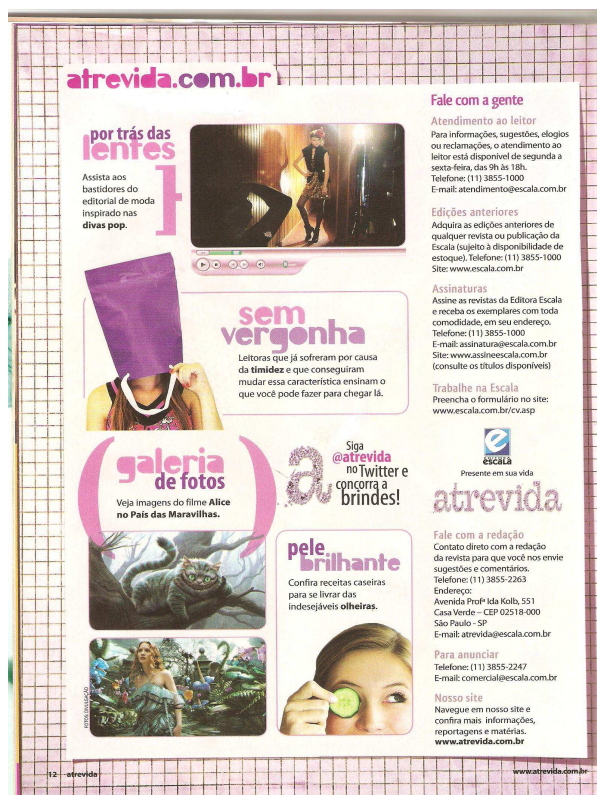
Figura 6 – Mídia impressa faz chamada à online

A seguir, a página da revista impressa, fazendo uma chamada ao conteúdo encontrado na mídia online .