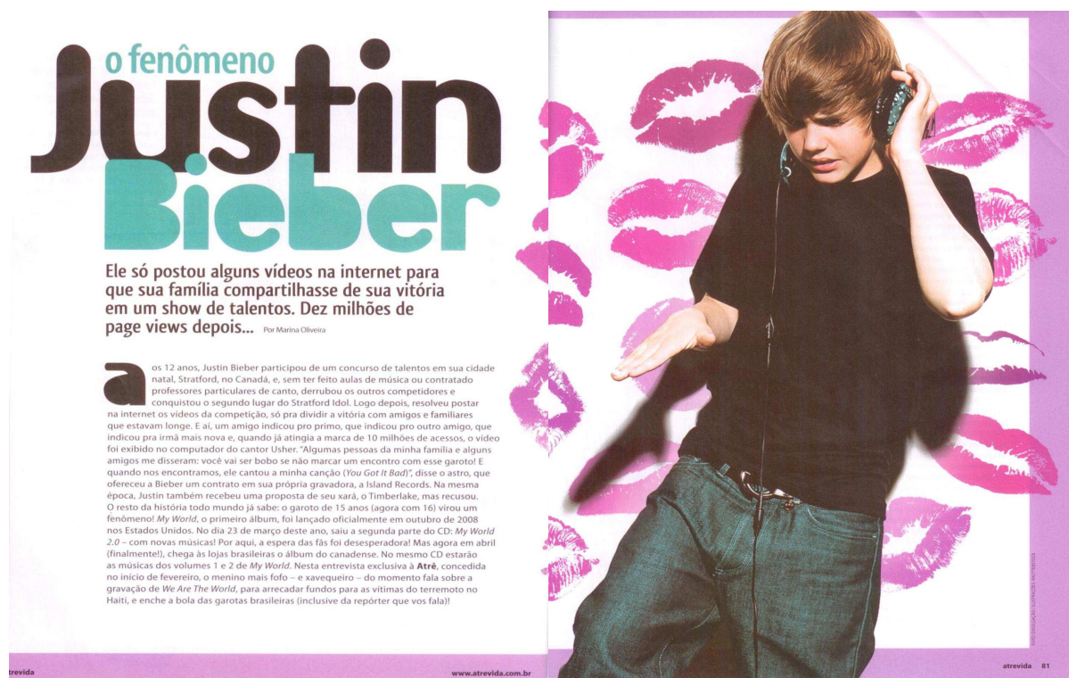
Figura 17 – O fenômeno Justin Bieber

Já no texto que precede a entrevista, observamos vários recursos linguísticos para fazer dessa entrevista uma conversa informal, sempre com a intenção de aproximar as leitoras do ídolo do momento: Justin Bieber. No trecho “[...] Mas agora em abril (finalmente) chega às lojas brasileiras o álbum do canadense [...]” (ATREVIDA, maio 2010, p.80), a repórter expressa felicidade por se tratar de algo tão esperado pelas fãs, o que indica valoração positiva sobre o cantor. Também utiliza gírias que fazem parte da linguagem adolescente como “xavequeiro” – ou seja, paquerador, galanteador – ou “menino mais fofo”, e até mesmo quando afirma que o cantor “enche a bola” das garotas brasileiras. Todos esses recursos linguísticos têm o intuito de estreitar a relação intersubjetiva, fazendo com que as leitoras se interessem pela entrevista.