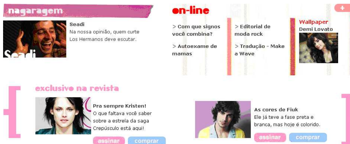
Figura 5 – Recursos exclusivos

Ao mesmo tempo em que a revista se apresenta de diversas formas, cada mídia faz uma chamada a outra, ou seja, no site , por exemplo, encontra-se um quadro com a apresentação dos artigos exclusivos da mídia impressa, e o que a leitora encontrará apenas na mídia online , como se pode verificar a seguir: