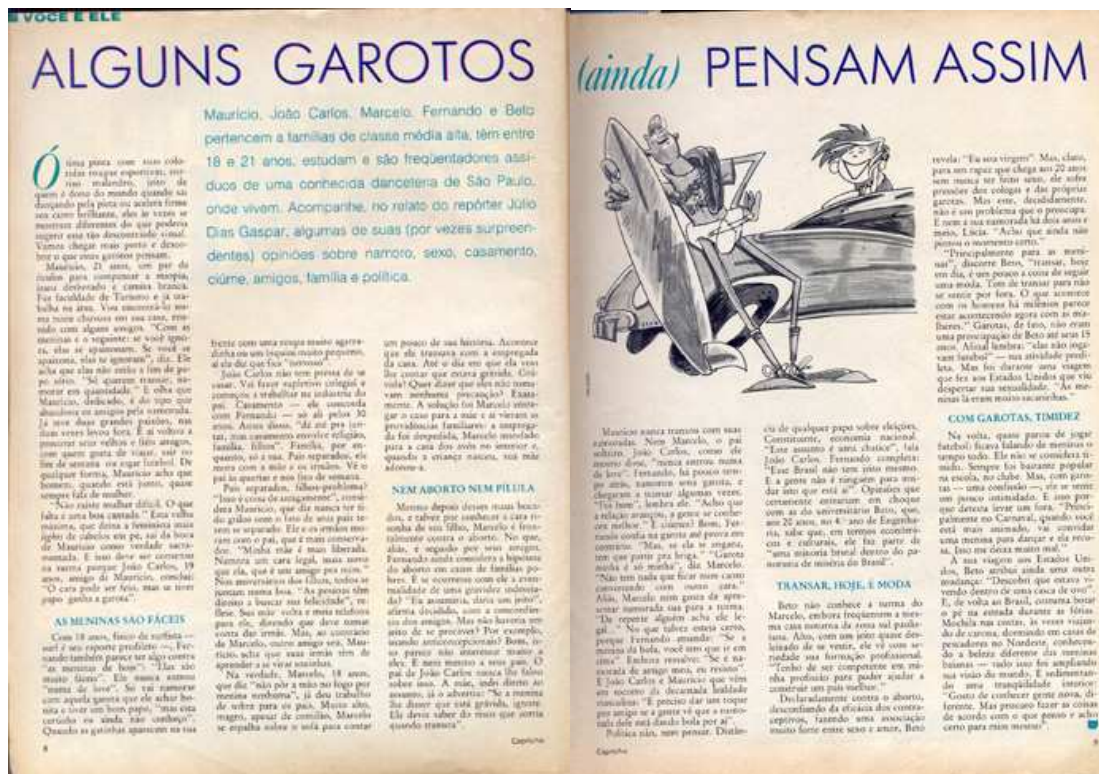
Figura 8: Reportagem com a participação de garotos.

Nas revistas da década de 80, as opiniões desses meninos apareciam inseridas em reportagens que abordavam questões de relacionamento entre eles e as meninas. O texto era escrito em duas páginas, cada qual dividida em três colunas, sendo, portanto, um texto longo. Além disso, havia participação tanto de meninos quanto de meninas. Há, na Figura 8, um exemplo desse modelo de reportagem, presente no exemplar de 1987, para ilustrar como isso ocorria.