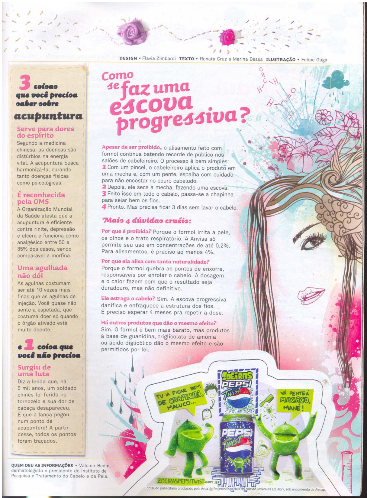
Figura 15: Inserção de anúncio publicitário no texto.