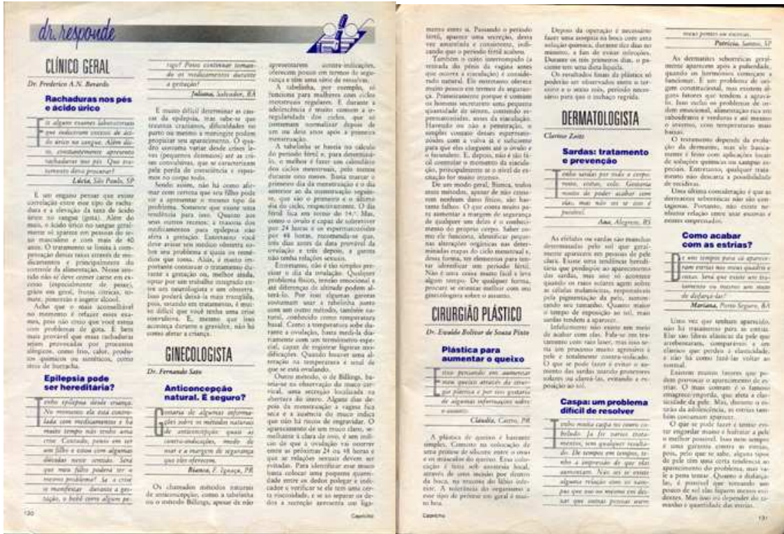
Figura 10: Seção “Dr. Responde”

Nos anos 90, acontece uma significativa mudança, tanto na forma de apresentação da página destinada a sanar dúvidas de leitores, quanto no direcionamento que se passa a ter para a questão do sexo – nesses exemplares, esse tema tem uma seção própria, não mais dividindo espaço com outras áreas da saúde, como dermatologia, cirurgia plástica etc. Ver Figura 11.