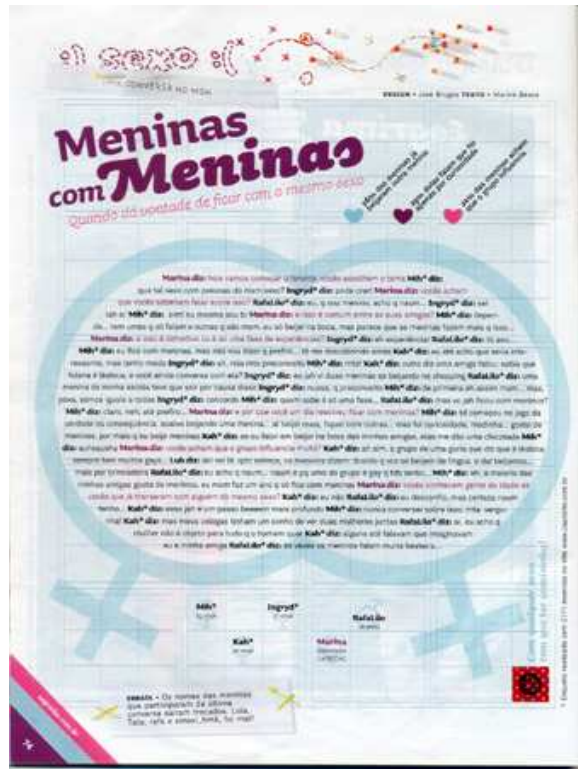
Figura 12: Seção “Sexo” (Meninas com Meninas)