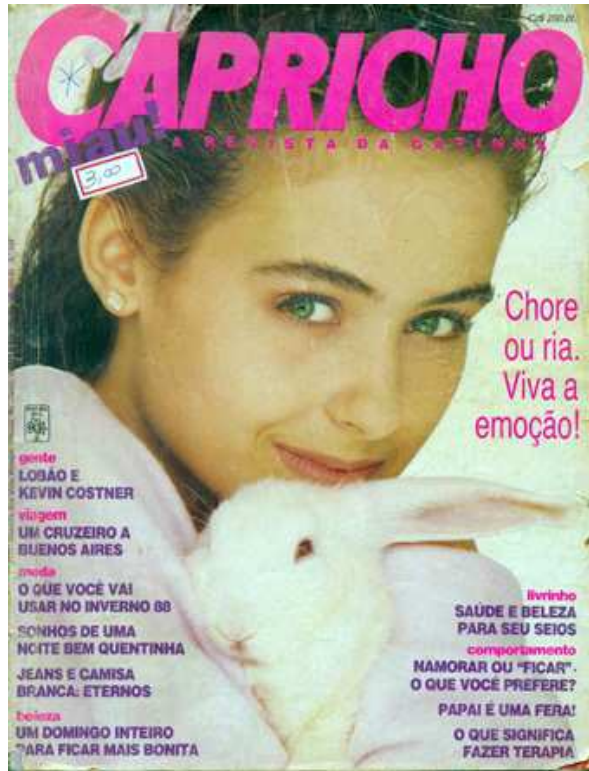
Figura 4: Capa da revista.

subtítulo da CAPRICHÔ , “A REVISTA DA GATINHA”, e uma interjeição ao lado do título, “ miau! ”, e não tinham relação com assuntos abordados na revista. Ver Figura 4.