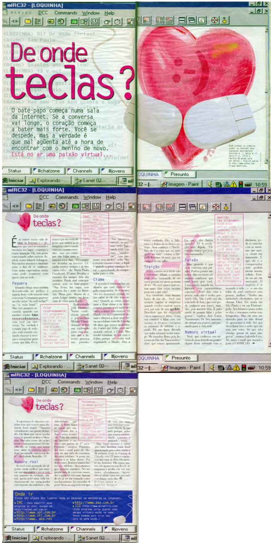
Figura 1: Reportagem sobre namoro virtual