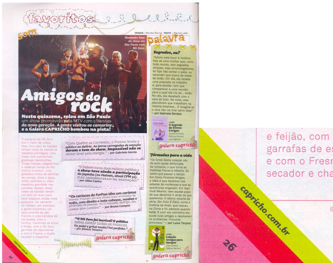
Figura 2: Página da revista com orelha em destaque.

Ainda nesse número, existe uma seção, “fale com a gente”, em que o leitor pode entrar em contato com a redação através de um e-mail e, na edição do ano seguinte, desde a capa, o leitor já tem a informação sobre qual é o site da CAPRICHÔ , o qual aparece novamente na seção “dúvida?”, juntamente com outras formas de contactar a revista. Já os exemplares de 2007 trazem o site da revista destacado em linhas coloridas em quase todas as páginas na orelha esquerda inferior, como mostra a seguir a Figura 2. Isso revela que a relação entre o suporte impresso da revista e o suporte digital se acentuou na última década.