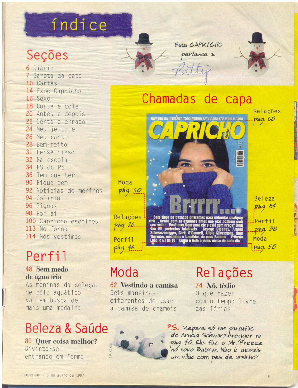
Figura 6: Sumário de 1997.