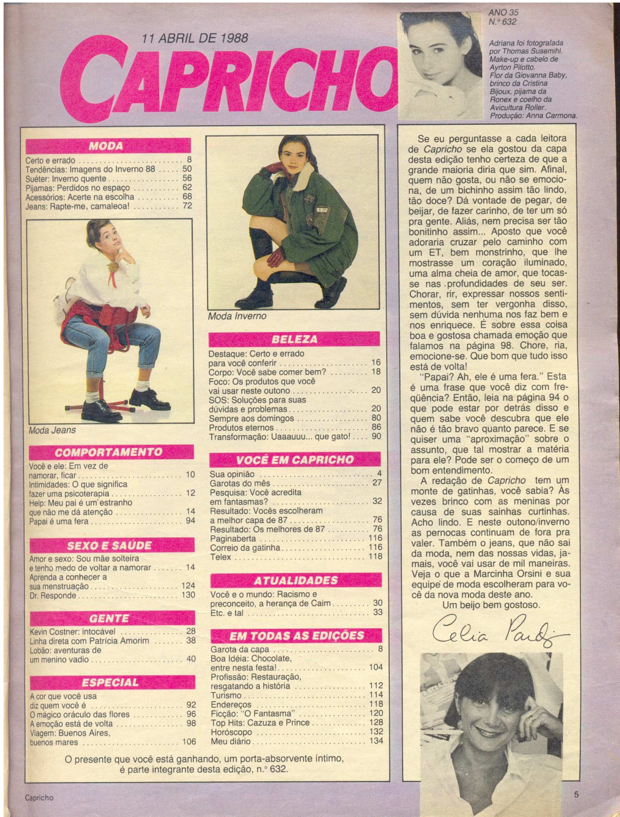
Figura 5: Sumário de 1988.