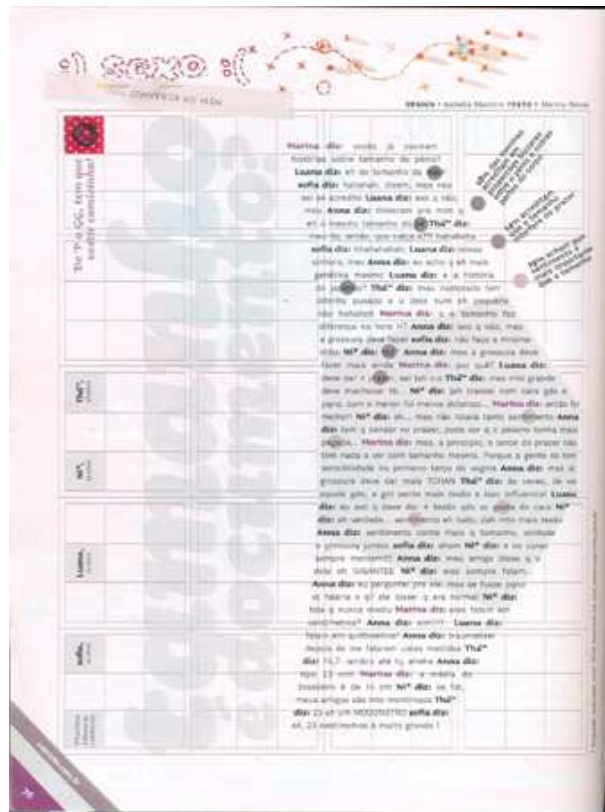
Figura 13: Seção “Sexo” (Tamanho é documento?)