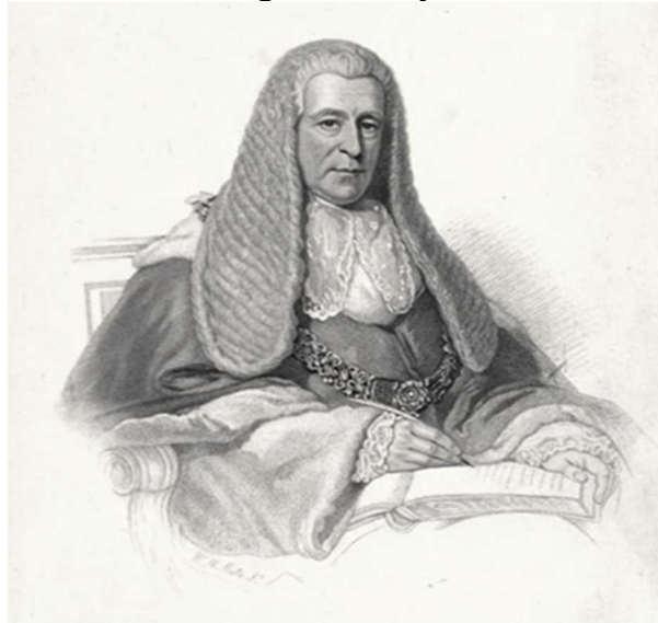
Figura 2 – Thomas Langlois Lefroy