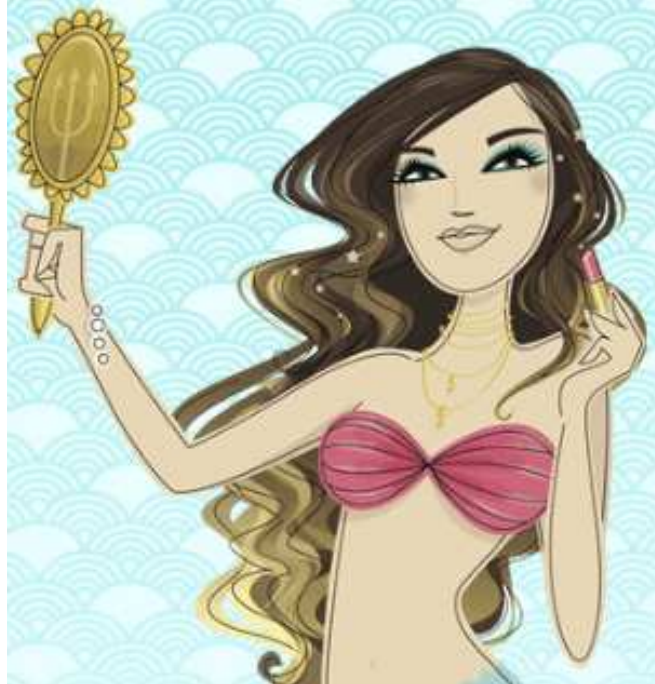
Figura 6 - Desenho de sereia ao lado do logotipo

Ao lado do logotipo, há um desenho de uma sereia segurando um espelho, como pode ser visto na figura 1, referente à página inicial do blog, e aparece recortado na figura a seguir: