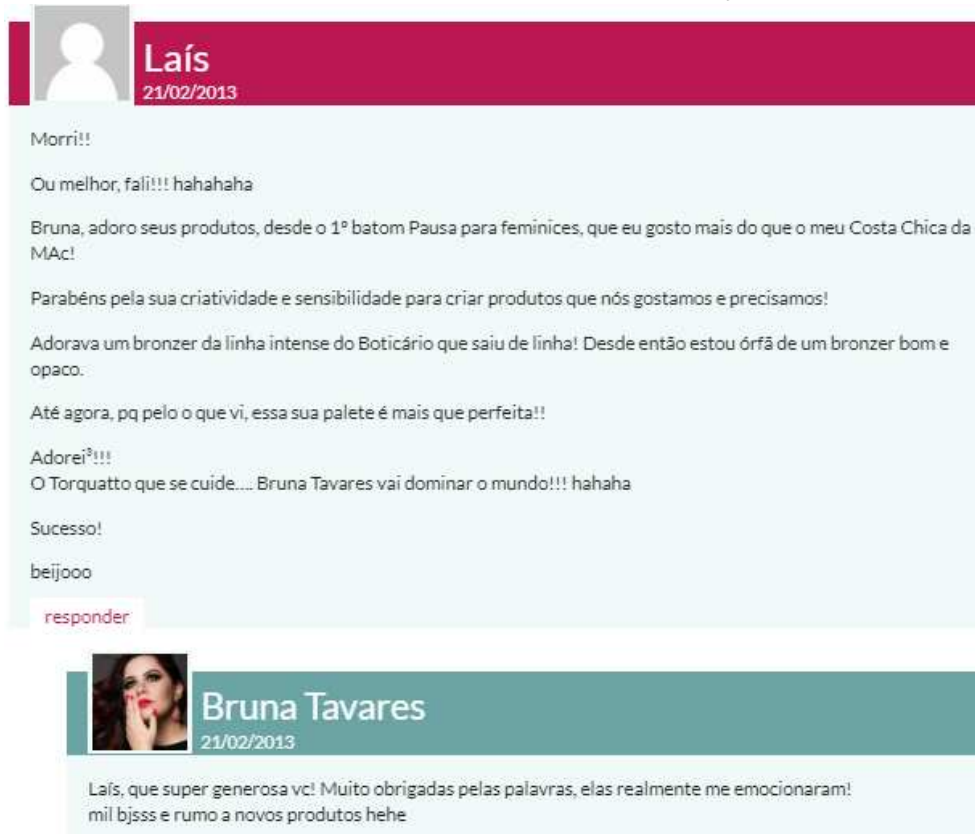
Figura 16 - Comentário em publicação