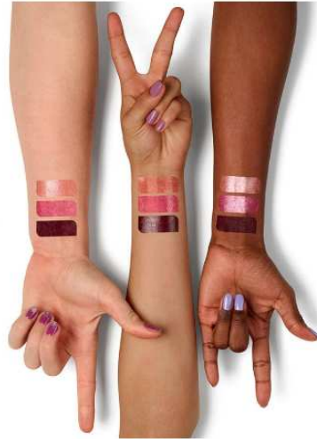
Figura 13 - Postagem de 4 de junho de 2019