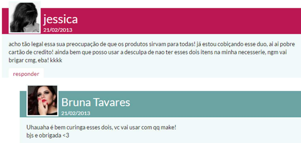
Figura 15 - Comentário em publicação