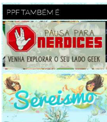
Figura 7 - Banner de redirecionamento para o blog Sereismo