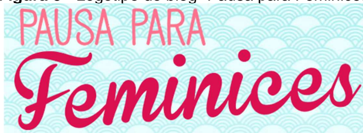
Figura 5 - Logotipo do blog “Pausa para Feminices”

Como se trata de um blog e, portanto, são utilizados recursos verbo-voco-visuais, a análise do logotipo e das imagens também são importantes para a compreensão da constituição de sentidos, como podemos verificar na figura 5: