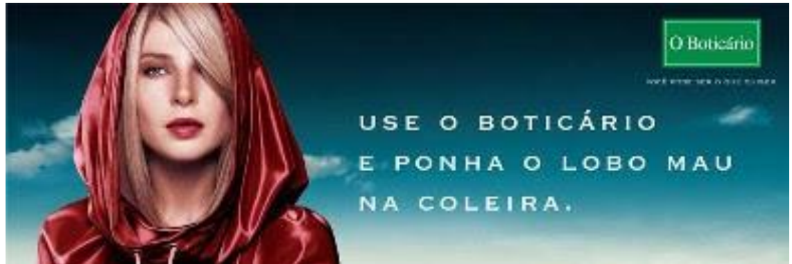
Figura 12 – Chapeuzinho Vermelho – O Boticário