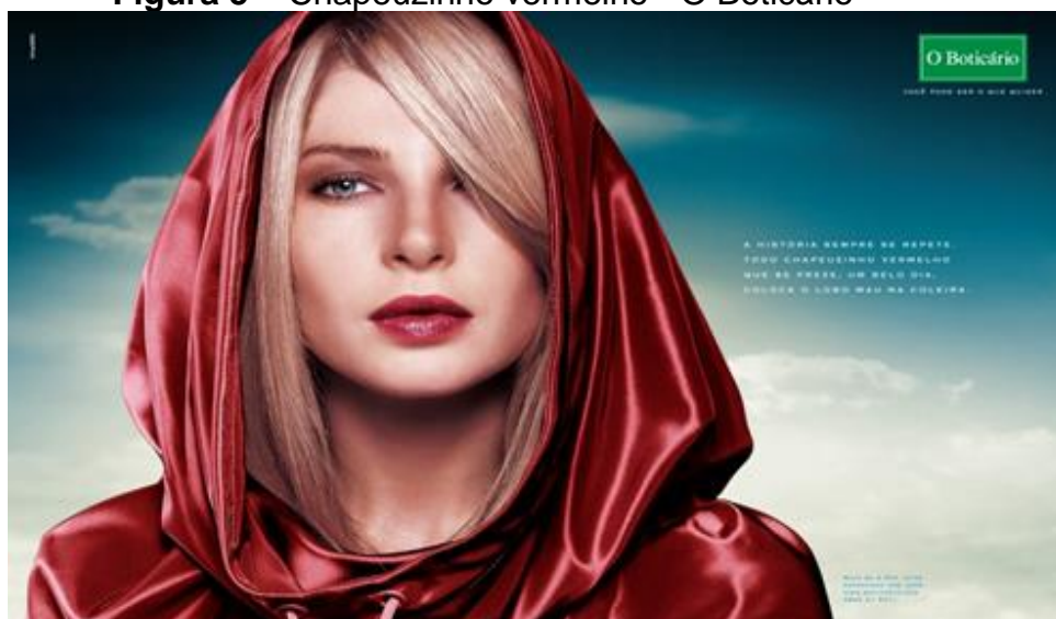
Figura 5 – Chapeuzinho vermelho - O Boticário

Em 2005, O Boticário lança a campanha centrada no mundo da fantasia: “Contos de Fadas”. A campanha foi produzida pela agência AlmapBBDO. Foram apresentados quatro anúncios e quatro outdoors , tendo como personagens principais Branca de Neve, Cinderela, Rapunzel e Chapeuzinho Vermelho. Caracterizadas nos contos de fadas por inocência e fragilidade, as personagens femininas são apresentadas nas peças publicitárias de modo bastante diferente, contextualizado na imagem feminina contemporânea, que remete à mulher sedutora, forte e independente, ou seja, o discurso publicitário manifesta uma outra ideologia, que põe em evidência valores que se contrapõem àqueles presentes no discurso literário. As imagens revelam um toque de malícia aliada à sedução e os slogans , transcritos a seguir, traduzem a postura da mulher que controla a própria vida e não se submete ao discurso machista, como se observa nas peças a seguir.