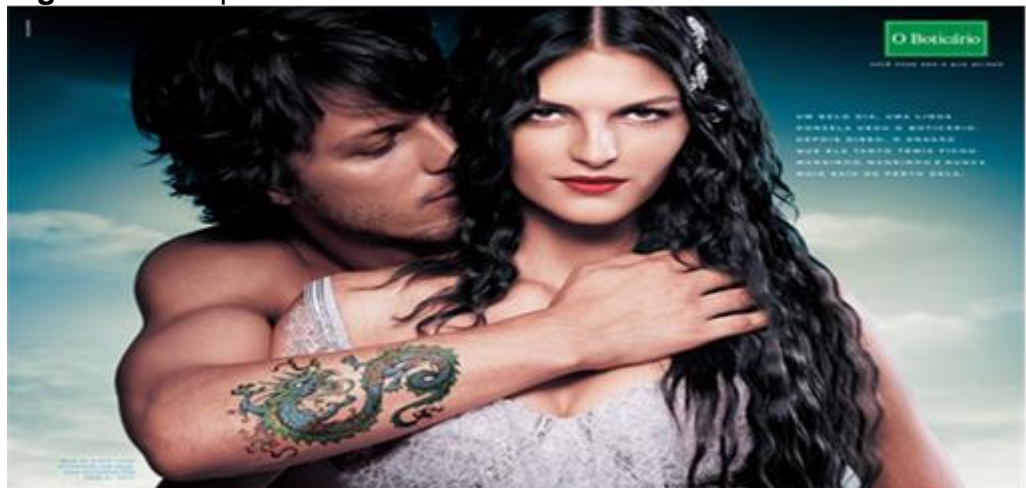
Figura 18 - Rapunzel: O Boticário