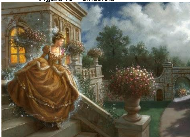
Figura 13 – Cinderela

disse a Cinderela que todo o encanto acabaria ao soar doze badaladas da noite. Quando o príncipe viu Cinderela, apaixonou-se e dançou a noite toda com ela, mas quando o relógio badalou anunciando meia noite, a bela moça, vai embora desesperada, perdendo, no caminho, um dos belos sapatinhos de cristal. No dia seguinte, o príncipe sai à procura da dona do sapato perdido, pois deseja se casar com ela, independente da posição social da moça. Após o sapato ser provado por todas as moças e não couber em nenhum pé, e, já sem esperanças, o príncipe coloca o sapatinho no pé da gata borralheira e a mesma torna-se sua esposa. Assim, Cinderela perdoa sua madrasta e irmãs e todos vivem felizes para sempre.