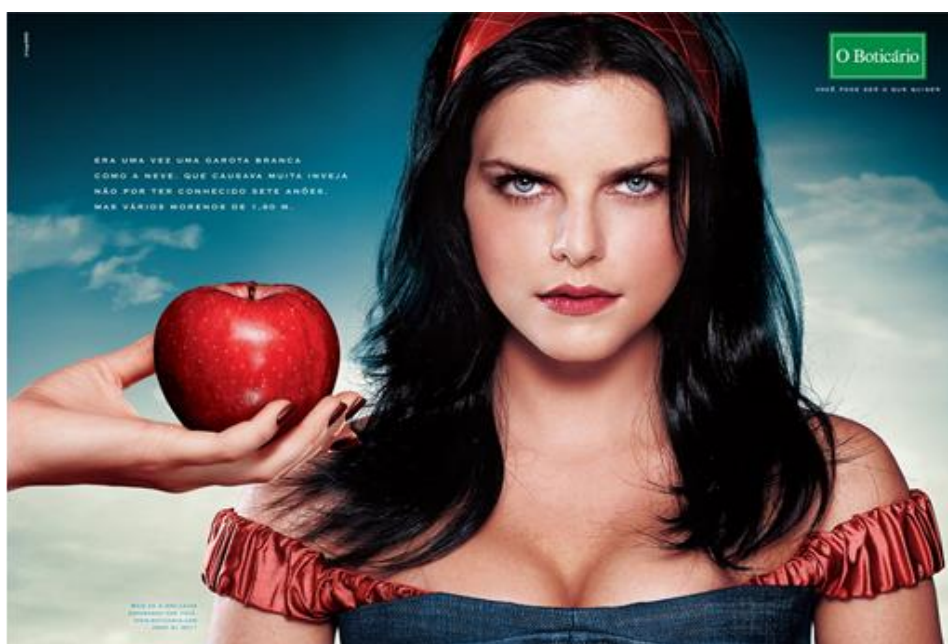
Figura 8 – Branca de Neve – O Boticário

Um belo dia, uma linda donzela usou “O Boticário”. Depois disso, o dragão que ela tanto temia ficou mansinho, mansinho e nunca mais saiu de perto dela.