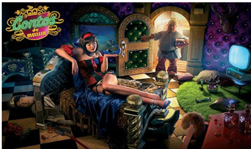
Figura 21 – Branca de Neve – Contos de Melissa

O cenário retomado na campanha publicitária “Contos de Melissa” é um quarto de paredes acolchoadas em cor púrpura. Nele, o príncipe aparece escondido em baixo da cama, enquanto outro homem – supostamente um dos sete anões - entra no quarto, cena que remete ao discurso de traição.