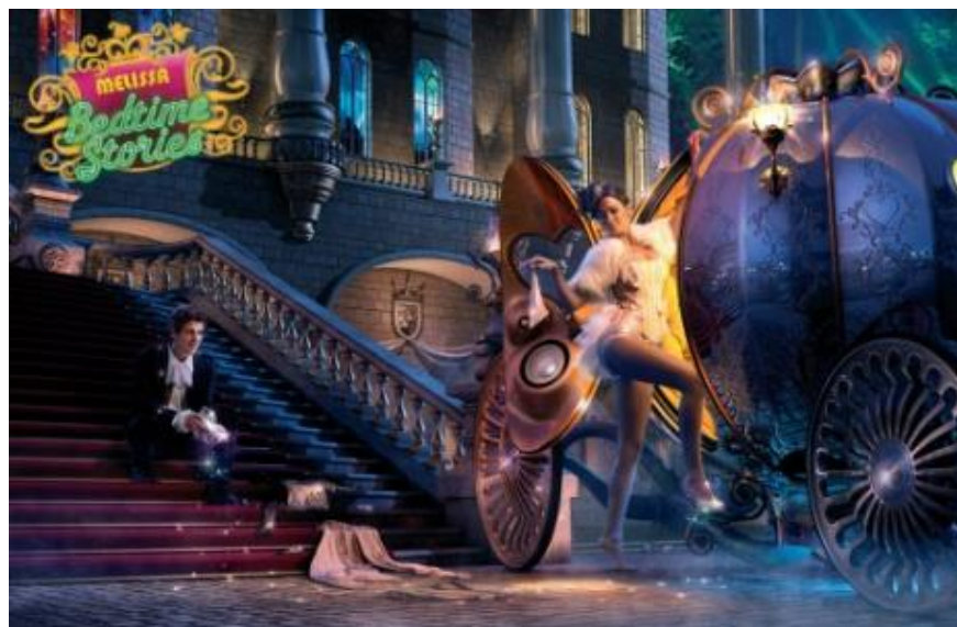
Figura 4 – Contos de Melissa: Cinderela