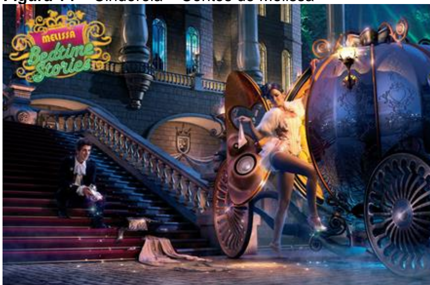
Figura 14 – Cinderela – Contos de Melissa