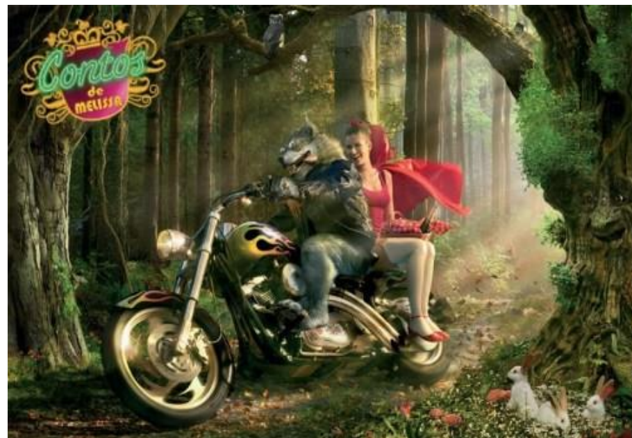
Figura 2 – Contos de Melissa - Chapeuzinho Vermelho