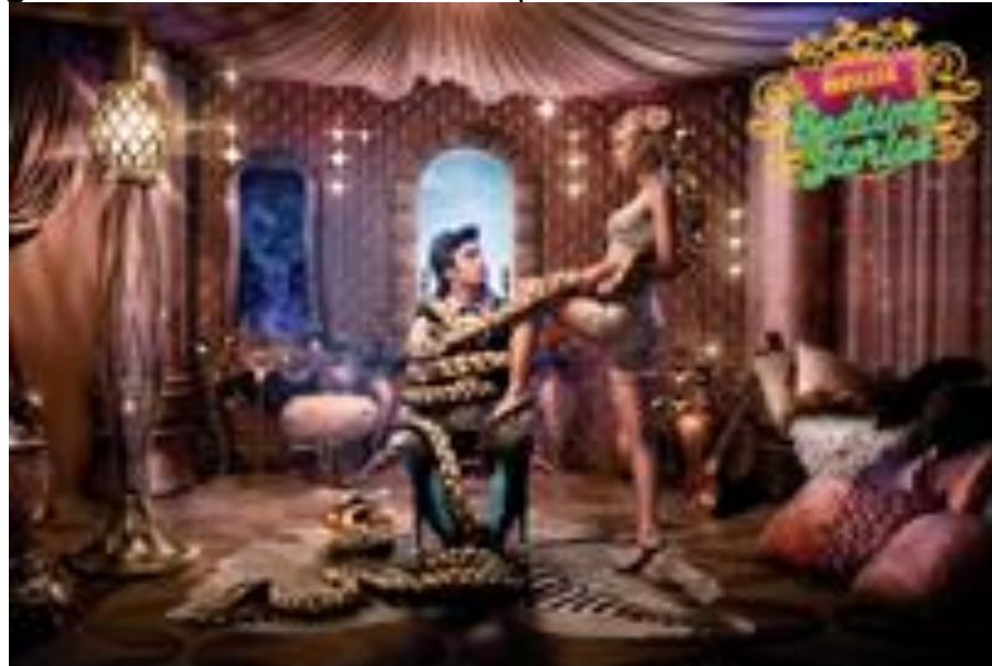
Figura 3 – Contos de Melissa - Rapunzel

DIAS, A. K.; ARÊAS, D.; DIAS, E. C.; GUTIERRE, M.M.B.