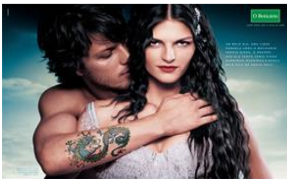
Figura 7 – Rapunzel – O Boticário

Gabriela vivia sonhando com seu príncipe encantado. Mas, depois que ela passou a usar “O Boticário”, foram os príncipes que perderam o sono.