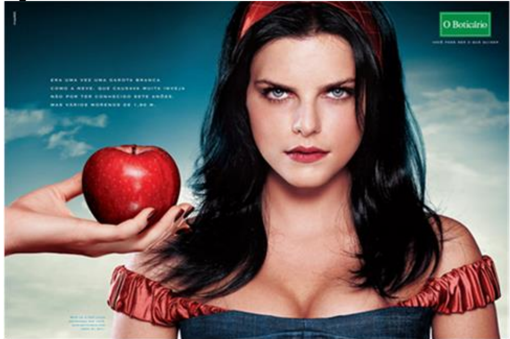
Figura 22 - Branca de Neve - O Boticário