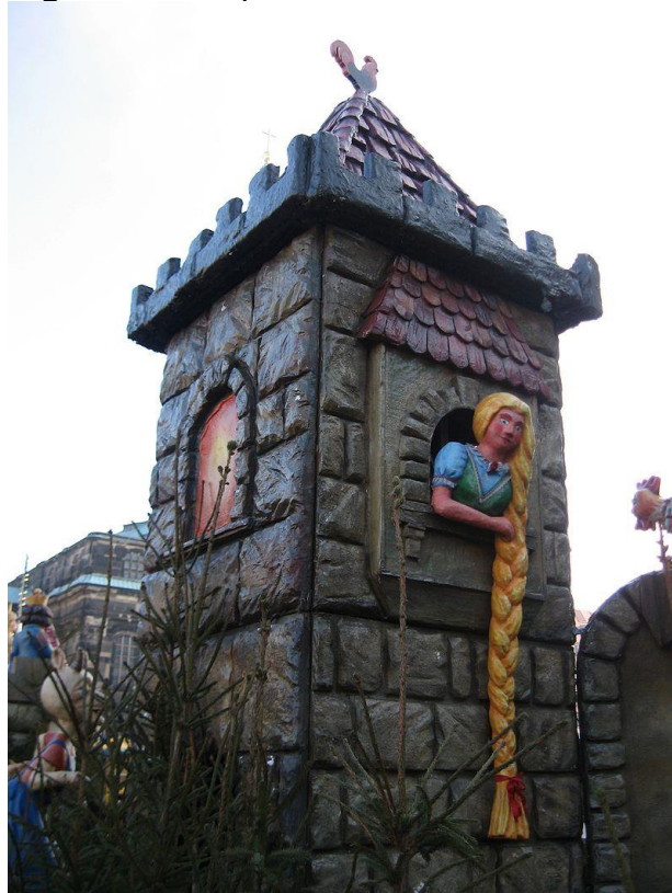
Figura 17 - Rapunzel

DIAS, A. K.; ARÊAS, D.; DIAS, E. C.; GUTIERRE, M.M.B.