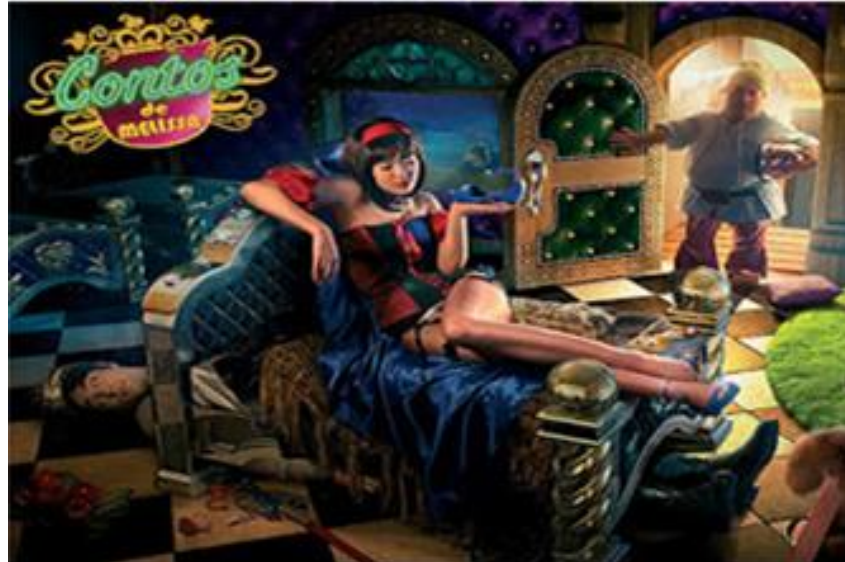
Figura 1 – Contos de Melissa – Branca de Neve