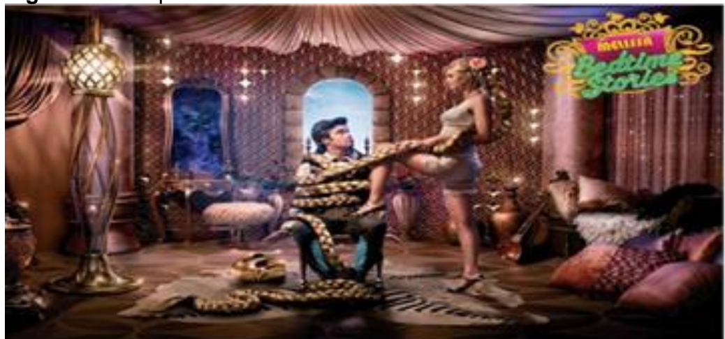
Figura 19 – Rapunzel – Contos de Melissa

A Rapunzel de Contos de Melissa aproxima-se de maneira mais direta da personagem da literatura, no que concerne à recuperação das tranças longas e loiras e do cenário alusivo à torre, como segue.