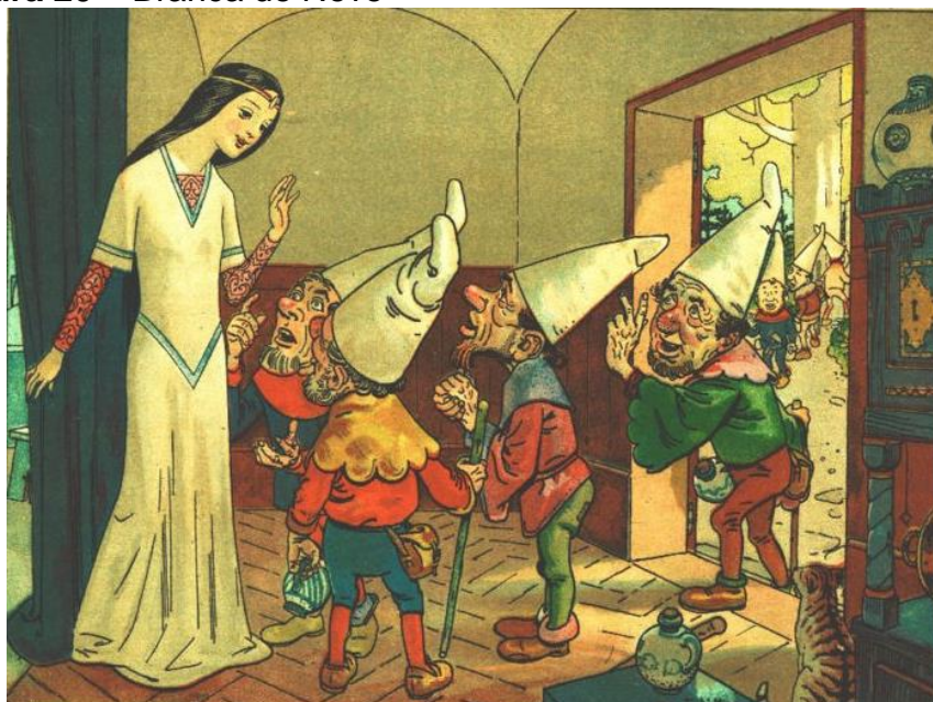
Figura 20 – Branca de Neve

O príncipe a pediu em casamento, e convidou para a festa a rainha má, que compareceu, morrendo de inveja. Como castigo, ao sair do palácio, acabou tropeçando num par de botas de ferro que estavam aquecidas. As botas fixaram-se na rainha e a obrigaram a dançar; ela dançou e dançou até, finalmente, cair morta.