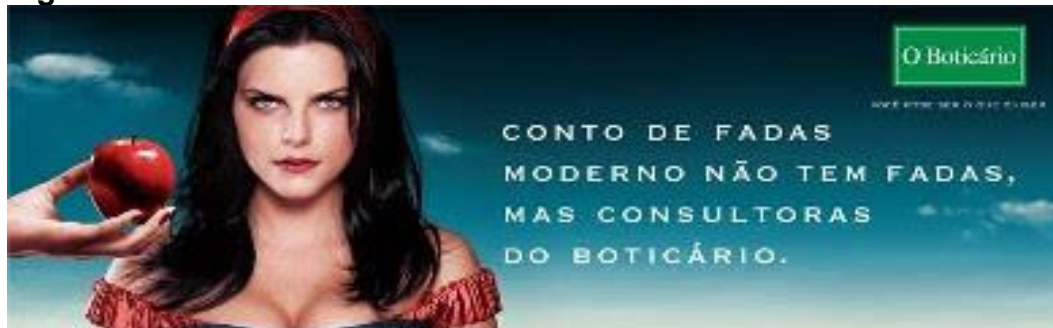
Figura 23 – Branca de Neve - O Boticário

DIAS, A. K.; ARÊAS, D.; DIAS, E. C.; GUTIERRE, M.M.B.