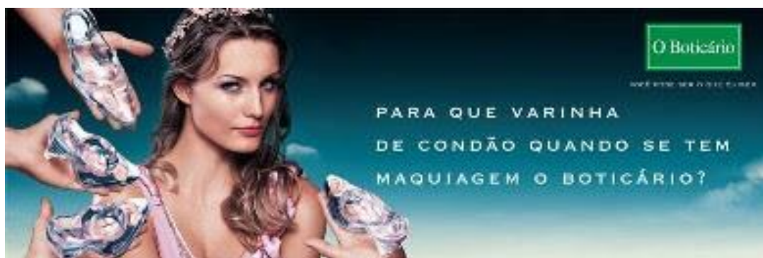
Figura 16 – Cinderela – O Boticário

O plano de fundo azul retoma o sentido de céu, de lugar tranquilo e sereno, bem como as imagens de nuvens brancas. Os sapatos sobre algumas mãos apontadas em direção à princesa, como se fossem mãos masculinas, reforçam a ideia de sedução e de poder, pois se subentende que ela não possui apenas um príncipe a sua disposição, querendo lhe conquistar, mas, sim, vários candidatos a príncipes. Dona de si e independente, é ela quem traça suas metas e escolhe seus parceiros.