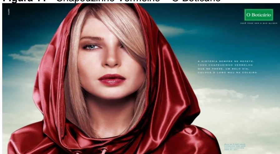
Figura 11 - Chapeuzinho Vermelho – O Boticário

Na campanha de O Boticário, “Contos de fadas”, a retomada e a identificação da personagem também ocorre simbolicamente, pelas vestes vermelhas. Na imagem da campanha o capuz é de cetim e de um uma cor vermelha viva, a cor da paixão, compondo uma imagem que demonstra não a ingenuidade, mas a sensualidade. Os cabelos loiros cobrindo um dos olhos, um olhar penetrante, lábios com batom vermelho da cor da capa, criam uma imagem misteriosa e sedutora. A pele clara da modelo revela um contraste perfeito com o vermelho vivo do capuz e, mais uma vez, o azul celeste e as nuvens, o plano de fundo da imagem, representam o céu, lugar místico e moradia dos anjos.