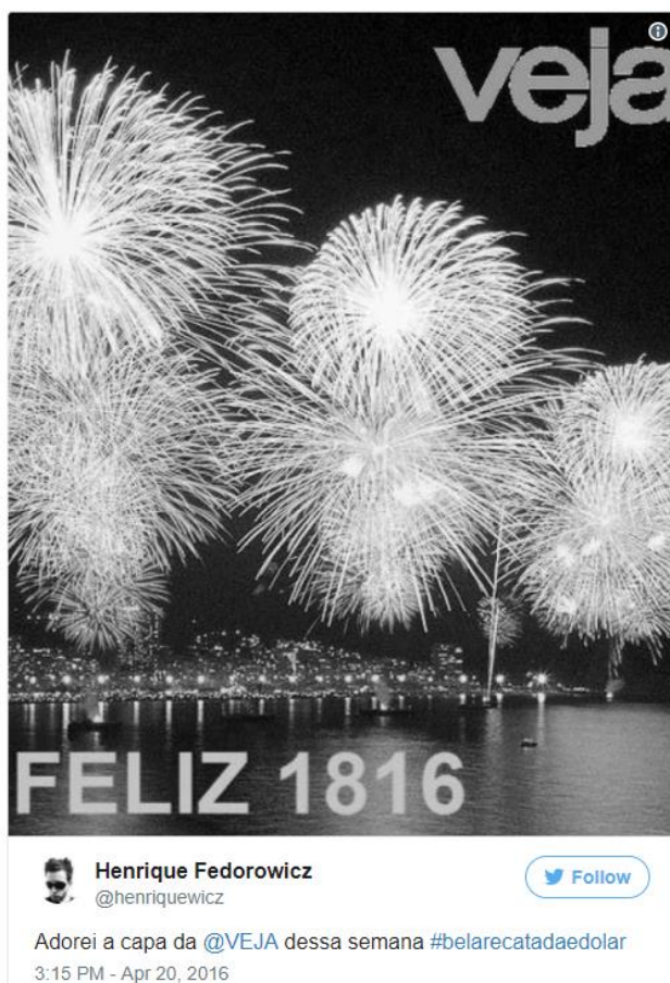
Figura 6 - Imagem simulando capa da Veja

Além disso, o termo recatada é substituído por desbocada, termo este que contrapõe a ideia de recato, que prevê resguardo e prudência, evocando a crítica de que a mulher pode falar o que acredita ser coerente, independente da ideia de ser ou não cuidadosa com as palavras, tendo em vista que, sob uma visão conservadora, a mulher é vista com uma postura delicada e prudente.