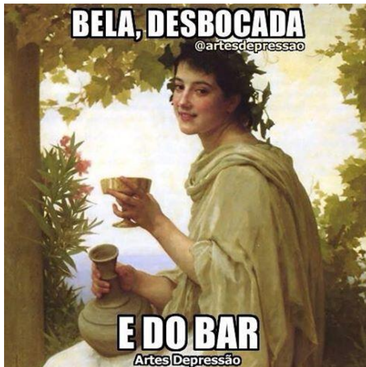
Figura 5 – Releitura em forma de meme do quadro Bacante William Adolphe Bouguereau