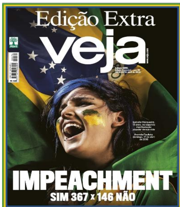
Figura 2 – Capa revista Veja , 21 de abril de 2016

Em abril de 2016, período em que o país passou pela votação no Congresso para a legitimação do Impeachment da presidente Dilma Rouseff, a revista Veja lançou uma edição especial para tratar de questões relacionadas ao processo que estava ocorrendo no país. Nessa edição, tratou desde assuntos relacionados à realidade que a política estava vivenciando até a previsão de que o vice-presidente, Michel Temer, assumiria o posto da presidência. A seguir, a capa da revista: