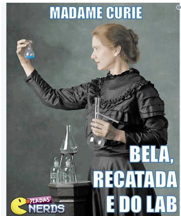
Figura 3 – Meme 6 Madame Curie

TORNAR-SE MULHER OU SER BELA, RECATADA E DO LAR? Uma análise discursiva uma maneira certa para uma mulher agir. A seguir, algumas manifestações nas redes sociais na semana da publicação do artigo: