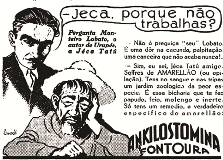
Figura1 - Diálogo entre Monteiro Lobato e Jeca Tatú