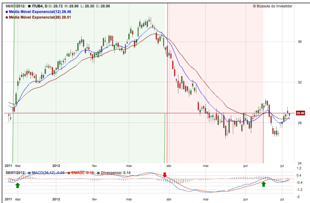
Figura 03: MACD

Disponível em: http://blog.bussoladoinvestidor.com.br/macd-convergencia-divergencia/