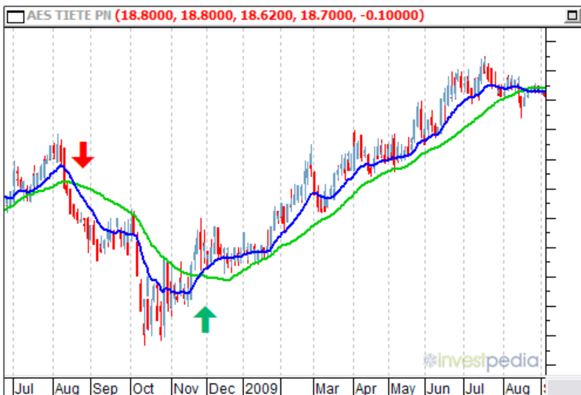
Figura 01: Tendência de Venda e Compra