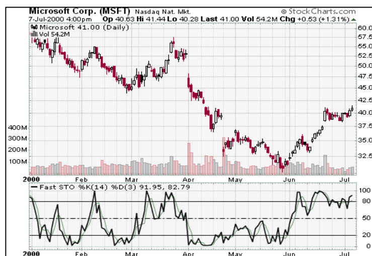
Figura 04: Estocástico