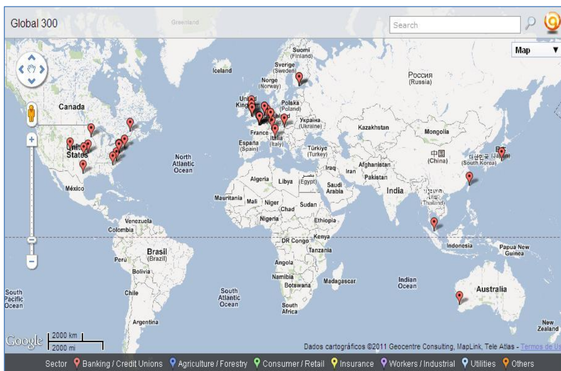
Figura 1- Maiores Instituições Cooperativas no Mundo