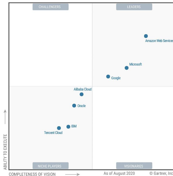
Figura 1 Provedores de nuvem mais utilizados 2020

A figura 1 mostra os provedores de nuvem mais utilizados de 2020, sendo a AWS a mais utilizada disparadamente.