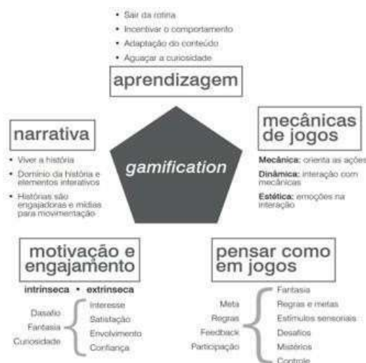
Figura 1: Variáveis que definem o conceito de gamificação.

A seguir pode-se verificar as cinco variáveis que compõe a definição do conceito de gamificação.