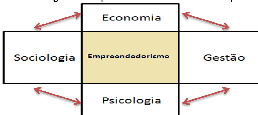
Figura 3 – Empreendedorismo como Interdisciplinar