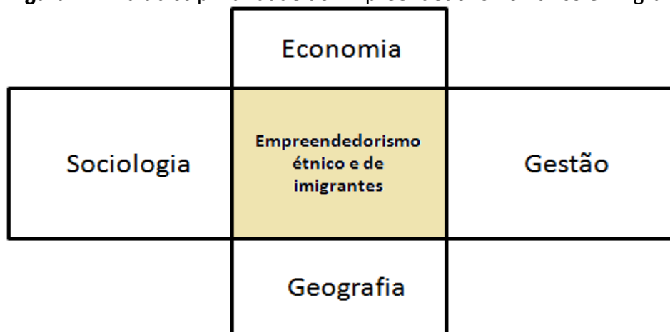
Figura 4 – Multidisciplinaridade do Empreendedorismo Étnico e Imigrante

O Quadro 1 ainda permite identificar que 32% dos artigos identificados no estudo de Cruz e Falcão (2017) foram assinados por apenas um autor. Dentre os trabalhos publicados em parceria, mais de 95% envolveram autores da mesma área de ensino. As principais disciplinas que sustentaram os artigos foram a Sociologia e a Geografia. Em menor quantidade, foram identificados trabalhos fundamentados em preceitos econômicos ou de gestão. As poucas interações entre disciplinas identificadas foram entre: (i) economia e geografia; (ii) economia e gestão; (ii) sociologia e geografia. Portanto, pode afirmar-se que o campo de estudos de empreendedorismo étnico e imigrante atua prioritariamente de forma multidisciplinar, ou seja, não há integração de conhecimentos das diferentes disciplinas que os abordam, assim como ocorreu com o desenvolvimento dos estudos sobre empreendedorismo conforme mostra a Figura 4.