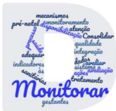
Figura 3: Nuvem de palavras dos desafios referentes à segunda categoria

Após as devidas análises, quatro desafios encaixaram-se na categoria 2, o que justifica o fato de, na figura 3, somente a palavra “monitorar” ter sido acentuada. Sendo assim, o monitoramento na área da saúde é um dos principais desafios a serem sanados, tendo em vista que comporta uma função essencial do administrador: o ato de controle.