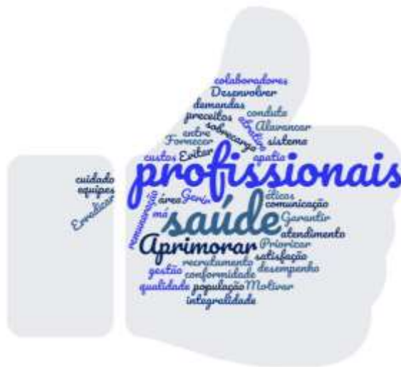
Figura 5: Nuvem de palavras dos desafios referentes à quarta categoria