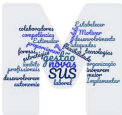
Figura 4: Nuvem de palavras dos desafios referentes à terceira categoria

Na referida categoria sobre o esforço adicional (diferencial) foram encontrados quatro desafios. Logo, os termos evidenciados na figura 4 são: SUS, novas e gestão. Associando os três elementos, constata-se que o diferencial aclamado pela literatura atrela-se à utilização de novas ferramentas de gestão no SUS.