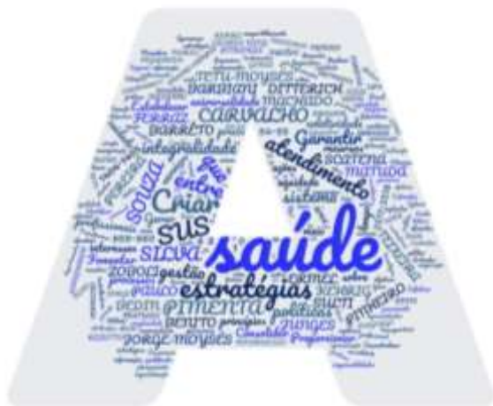
Figura 2: Nuvem de palavras dos desafios referentes à primeira categoria

Na figura 2, elaborada a partir dos desafios identificados, destacam-se as palavras: saúde, criar, SUS, estratégias e atendimento. Ao estabelecer-se uma ligação entre os cinco destaques, nota-se que o termo "criar" indica que os maiores desafios do administrador diante do âmbito estratégico sanitário é justamente criar estratégias sobre aspectos específicos do Sistema Único de Saúde (SUS), como a gestão do atendimento, isto é, construir o que inexistente no SUS sem a gestão adequada do sistema.