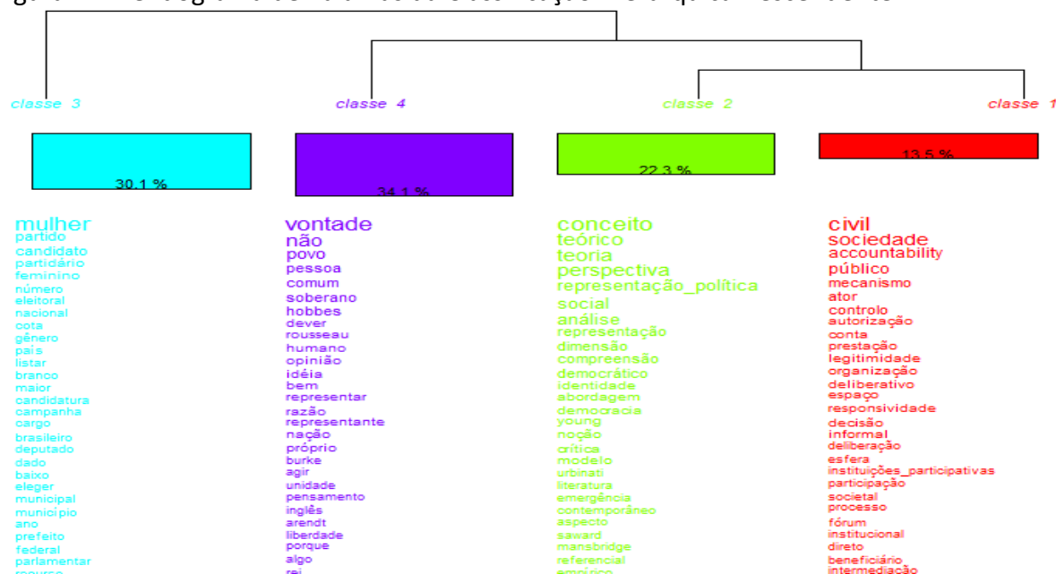
Figura 2 – Dendograma de Palavras da Classificação Hierárquica Descendente

Fonte: Dados da pesquisa organizados com suporte do software IRaMuTeq®.