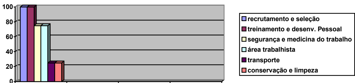
Gráfico 2: Responsabilidades do setor de Recursos Humanos

Quando indagados a respeito das atividades exercidas pelo setor, foram fornecidas as seguintes respostas: recrutamento e seleção de funcionários (100%); treinamento e desenvolvimento de pessoal (100%); empréstimos a funcionários (100%); rotina e prevenção relacionada à área de segurança e medicina do trabalho (75%); organização de eventos e atividades recreativas (75%); suporte emocional e orientação a funcionários (50%);