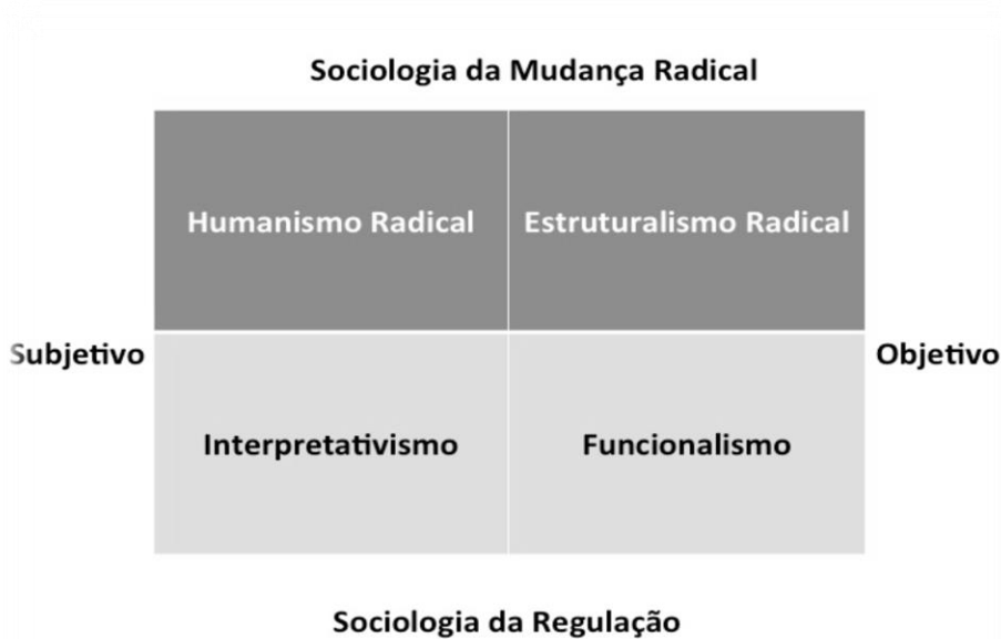
Figura 2: Diagrama de Burrell e Morgan

A categoria sociologia da regulação é usada para se referir a teóricos que focam em prover explicações da sociedade em termos de unidade e coesão. O interesse que fundamenta tal sociologia é a regulação das atividades humanas, bem como a necessidade de entender o motivo pelo qual a sociedade é mantida como uma entidade. Já a sociologia da mudança radical, em contraposição à sociologia da regulação, tem como foco de atenção na descoberta de explicações para a mudança radical, os conflitos estruturais, os modos de dominação e a contradição estrutural vigentes na moderna sociedade (BURRELL e MORGAN, 1979).