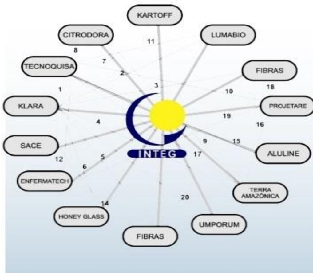
Figura 1 – Empresas instaladas na Incubadora Tecnológica de Guarapuava.