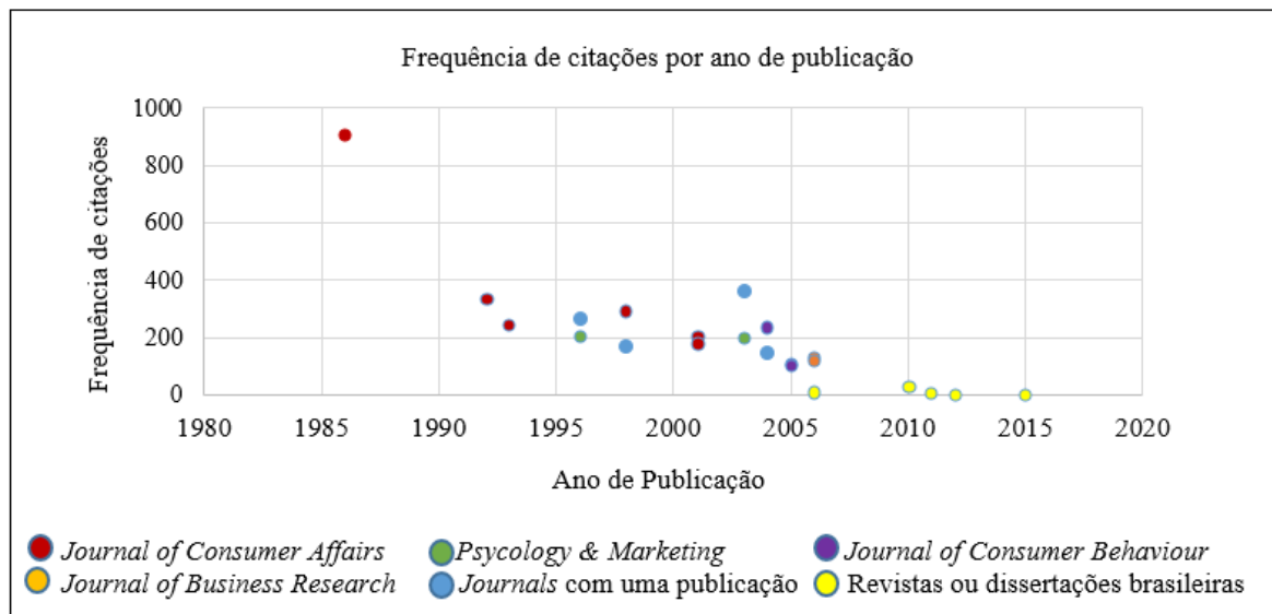
Gráfico 1: Frequência de citações por anos, para os principais periódicos

De posse dos dados da Tabela 1, foi elaborado um diagrama para melhor visualização do ano de publicação e frequência de citação dos artigos, o qual é apresentado no Gráfico 1, que também destaca as publicações nacionais e periódicos que publicaram dois ou mais estudos relevantes.