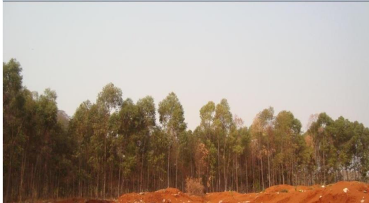
Figura 5: Aterro sanitário de Cristais Paulista com eucalipto plantado em valas niveladas ao fundo e novas valas no primeiro plano (2011)