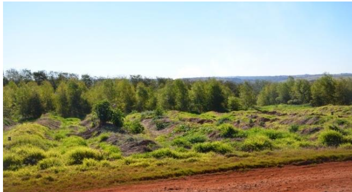
Figura 6: Vista panorâmica do aterro de Patrocínio Paulista, no primeiro plano, valas a ser plantadas e ao fundo eucaliptos plantados com um ano de idade (2013)