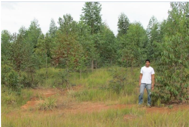
Figura 4: Aterro sanitário de Rifaina encerrado com eucalipto plantado (2011)