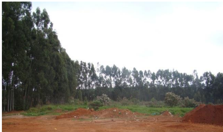
Figura 7: Vista panorâmica do aterro de Itirapuã