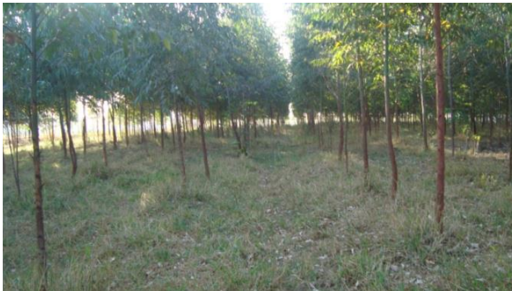
Figura 2: Antigo lixão em valas de São José da Bela Vista (2009)