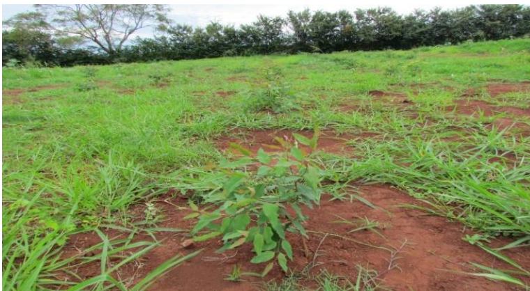
Figura 3: Encerramento do Aterro sanitário de Restinga, após nivelamento do solo com eucalipto recém plantado (2011)