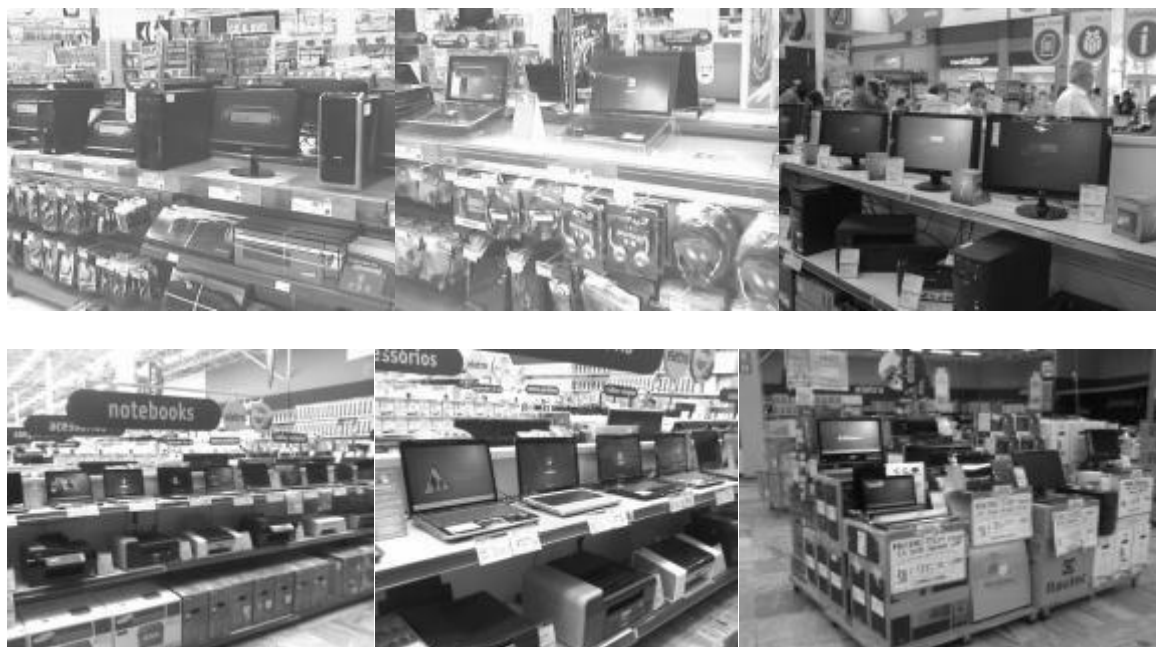
Figura 1: Exposição de computadores em lojas Hipermercadistas

(fotos do Extra, Carrefour e Wal Mart, 2010) por Daniela A.F.P. Coelho.