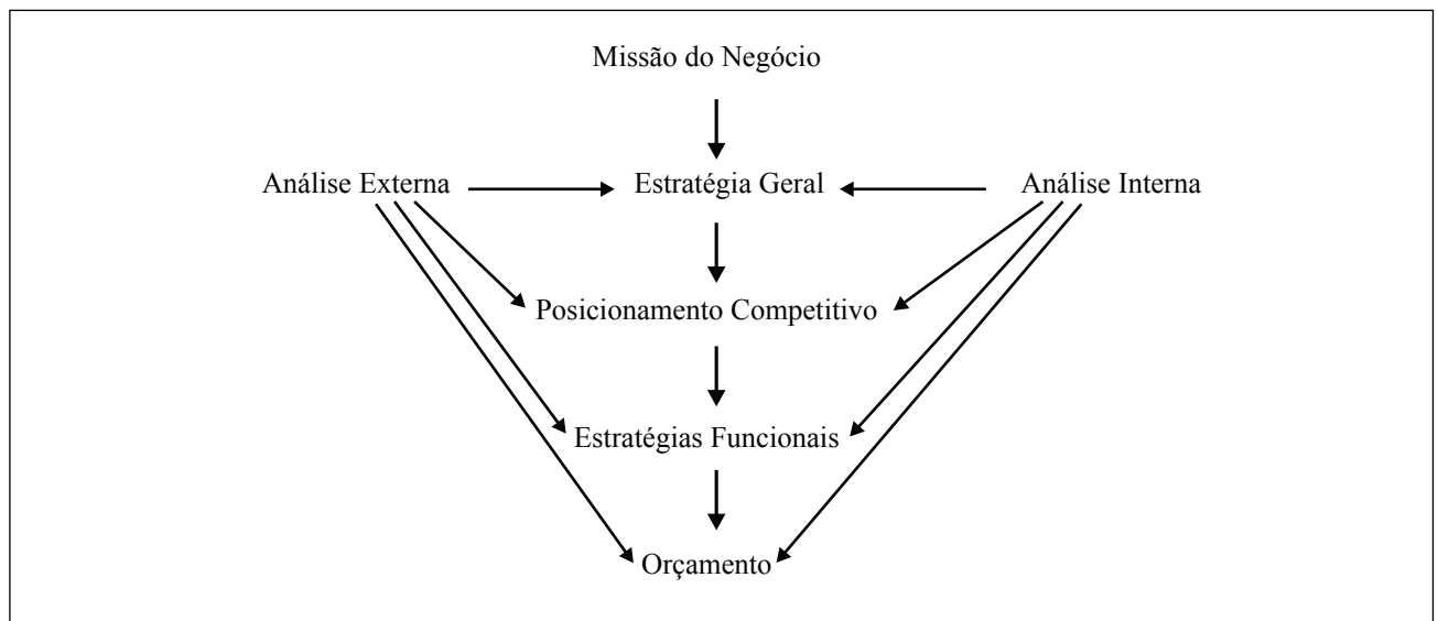
Figura 3 – Modelo de planejamento estratégico

Observe-se que, no sentido de proporcionar o dinamismo requerido no atual contexto em que as empresas estão inseridas, o modelo proposto ressalta que as análises externas e internas devem contribuir também para a definição do posicionamento competitivo, das estratégias funcionais e até mesmo do próprio orçamento (ABELL, 1978; SUDHARSHAN, 1995).