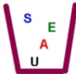
Figura 2. O esquema S.E.A.U de crítica de limites.

levando em consideração o sistema de referência A (contexto da ação responsável). O pesquisador buscava realizar a pesquisa de forma a reduzir o máximo possível a possibilidade de que ela contribuísse na expansão do contágio por Covid-19.