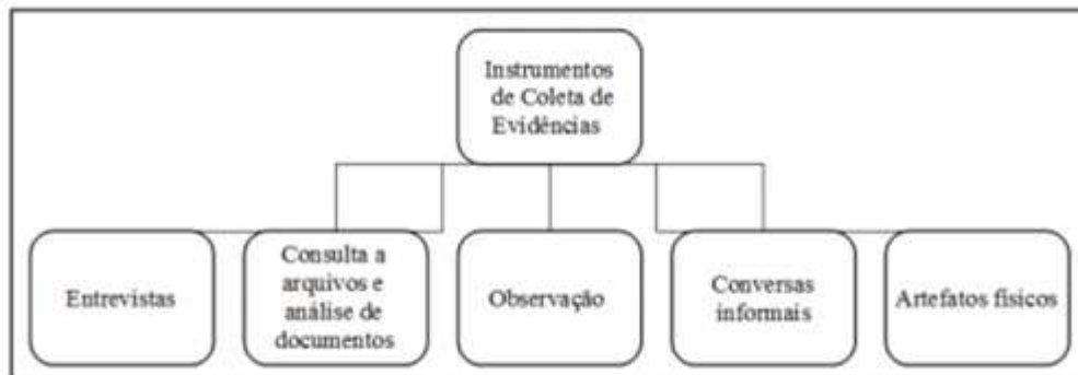
FIGURA 4. Principais instrumentos de coleta de evidências

Fonte: Adaptado de Eisenhardt (1989), Voss, Tsikriktsis e Frohlich (2002), Yin (2005) e Bryman (2008) apud Freitas e Jabbour (2011; p. 16).