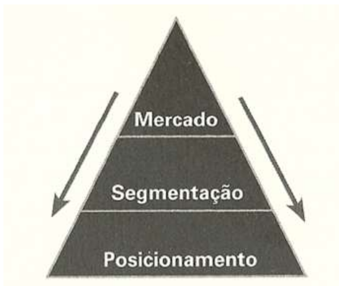
FIGURA1. Posicionamento de marca