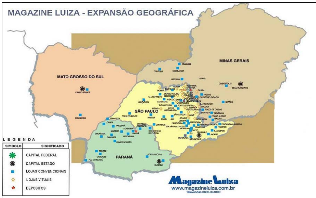
Grafico 1 – Mapa da Rede de Lojas do Magazine Luiza