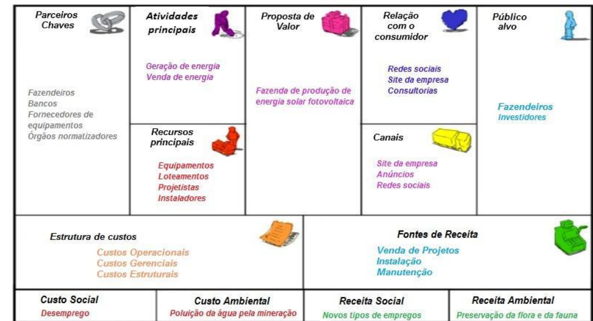
Figura 2 - Modelo Canvas de uma fazenda solar