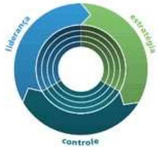
Figura 1 – Mecanismos de governança

governamentais, evitando o interesse próprio e, se necessário, agindo contra um interesse organizacional percebido. Agir no interesse público implica um benefício mais amplo para a sociedade, o que deve resultar em resultados positivos para os usuários do serviço e outras partes interessadas (GOOD... 2013, p. 13, tradução nossa).