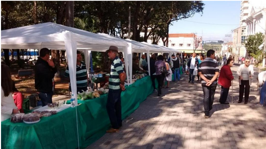
Figura 3. Feira da Agricultura Familiar (2017)