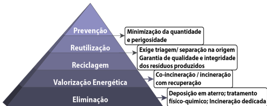
Figura 4: Princípio da Hierarquia das operações de Gestão de Resíduos