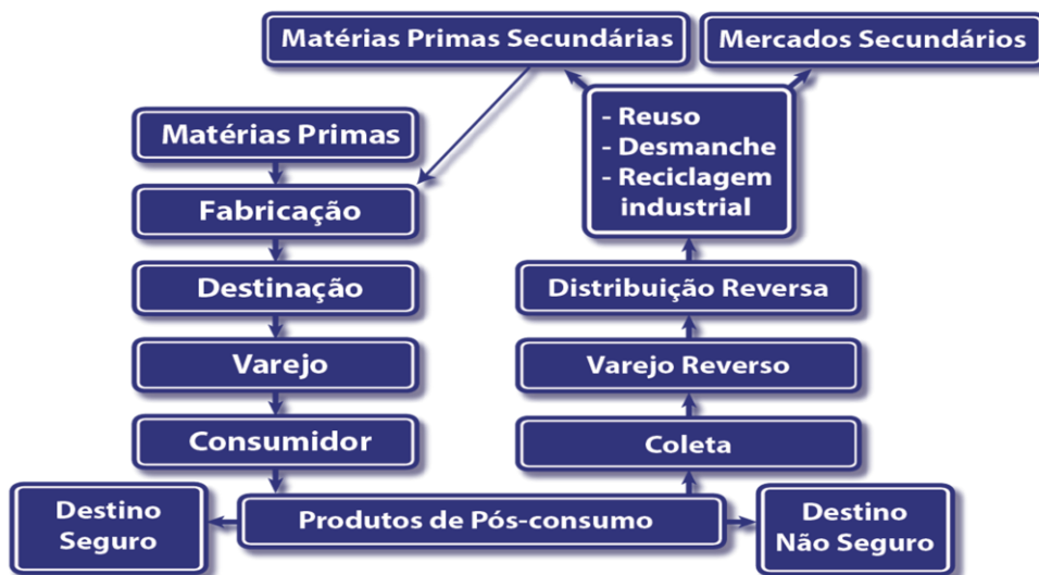
Figura 3. Fluxograma Logístico Reverso do Pós-consumo