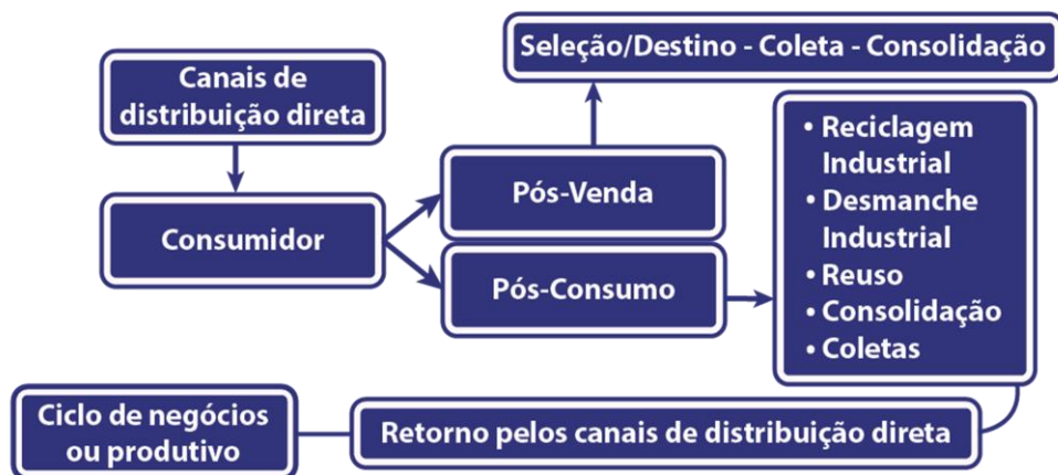
Figura 1 – Tipos de fluxo reverso