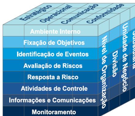
Figura 2 - Método utilizado pelo COSO II

O COSO II é representado por uma figura em forma de cubo, que mostra as quatro categorias de objetivos (estratégicos, operacionais, de comunicação e conformidade), estão representadas nas colunas verticais, os oito componentes nas linhas horizontais e as unidades de uma organização na terceira dimensão. Essa representação ilustra a capacidade de manter o enfoque do gerenciamento de riscos de uma organização, ou na categoria de objetivos, componentes, unidade da organização ou qualquer um dos subconjuntos. (COSO, 2007, p.7). Esse modelo está representado na Figura 2.