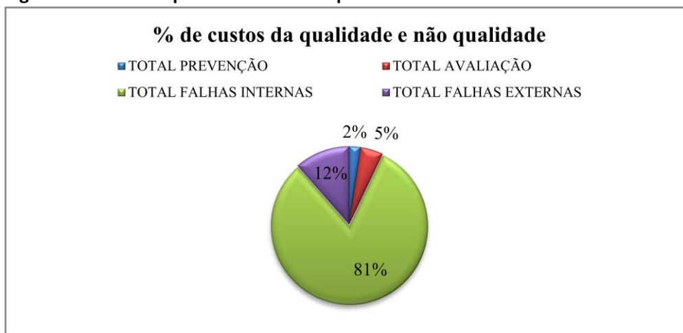
Figura 2: Custos da qualidade e da não qualidade

A partir das informações coletadas foram identificados os custos da qualidade (de prevenção e de avaliação), e da não qualidade (de falhas internas e de falhas externas), subcategorias preconizadas no aporte teórico. Observa-se, por meio da Figura 2, que os custos incorridos e que envolvem a não qualidade são superiores aos custos da qualidade.