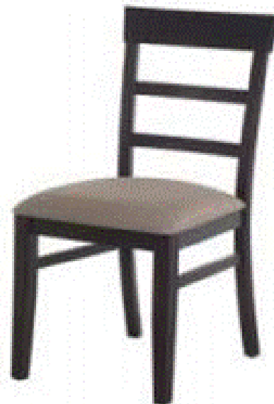
Figura 1: Cadeira produzida pela empresa

Atualmente, a venda de cadeiras de madeira é de grande importância no faturamento da indústria moveleira, aproximadamente 20% do faturamento total. A Figura 1 apresenta um tipo de cadeira produzida pela empresa.