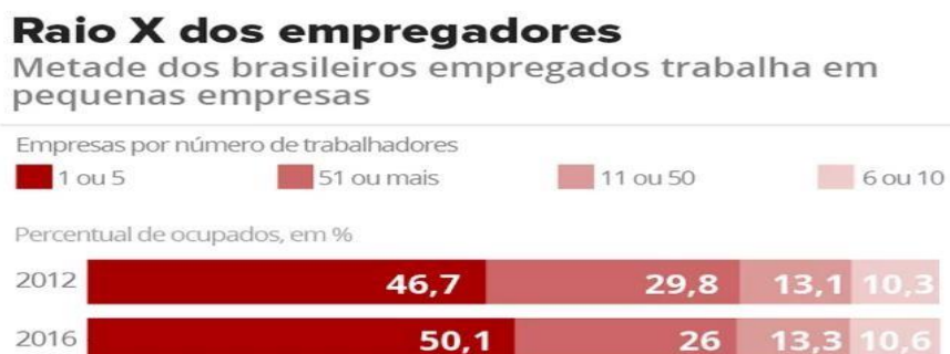
Figura 2 – Empresas por números de trabalhadores