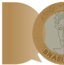
Figura 1 – Análise Imposto de Renda e Contribuição Social Diferido