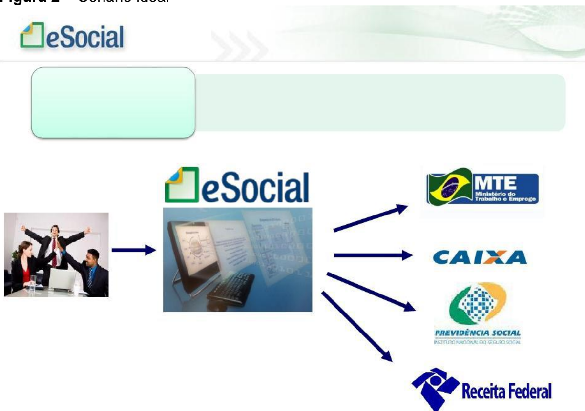
Figura 2 – Cenário ideal