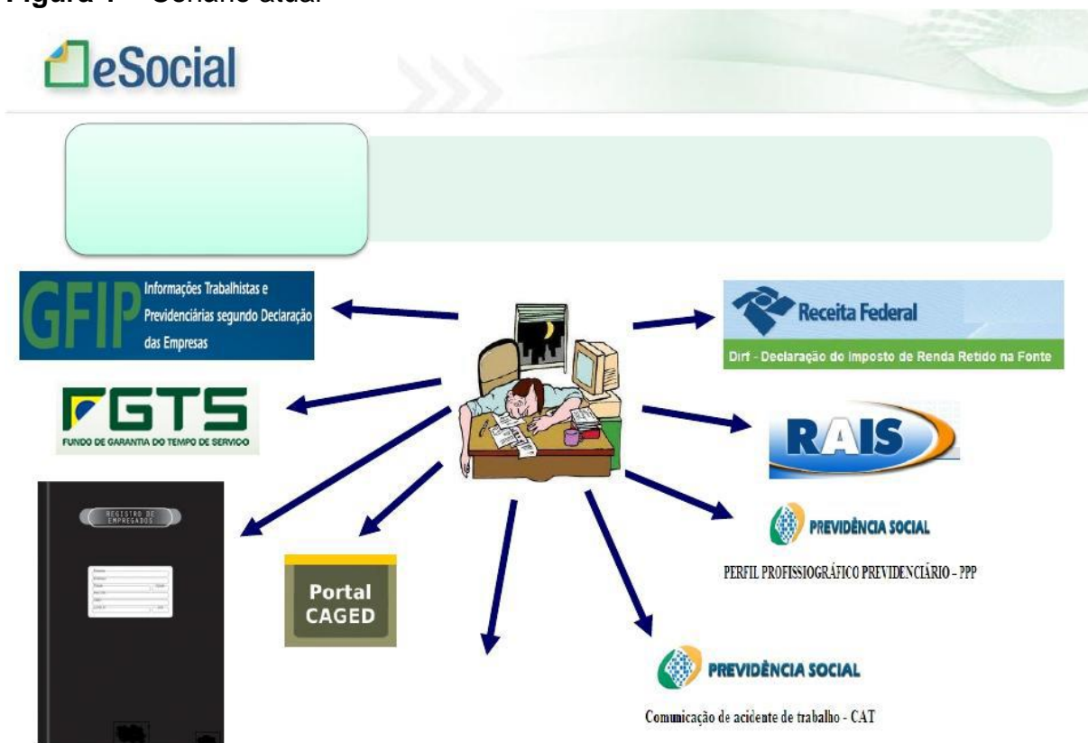
Figura 1 – Cenário atual