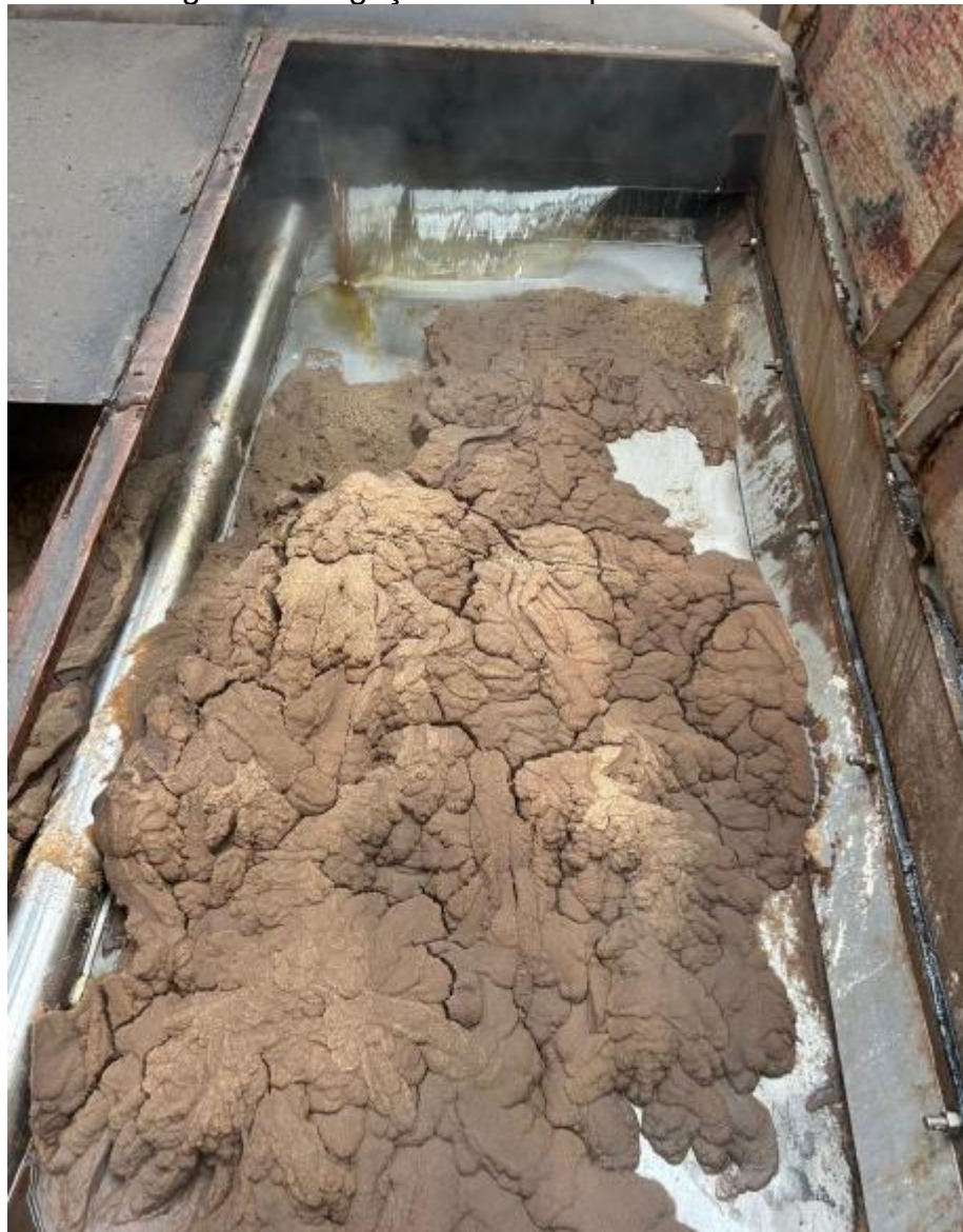
Figura 4 - Bagaço filtrado na peneira estática