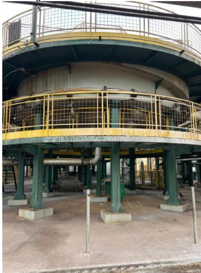
Figura 5 - Escadarias dos flotores.