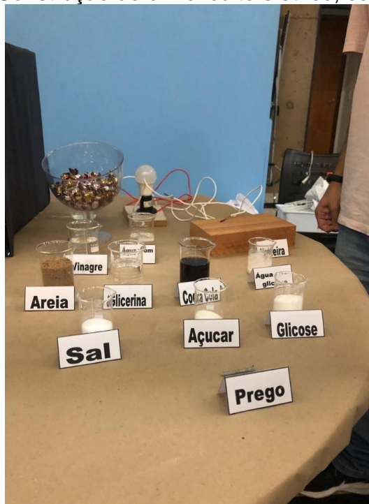
Figura 3: Construção de um circuito elétrico, com lâmpada.

Desse modo, foi criado um circuito (Figura 3) em que o ponto central era uma lâmpada, uma de suas extremidades era ligada à tomada e a outra extremidade era aberta, possuindo dois fios desencapados, que eram colocados nas substâncias e materiais. Dessa forma, as substâncias capazes de conduzir corrente elétrica promoviam o fechamento do circuito, acendendo a lâmpada, enquanto aquelas que não conduziam eletricidade faziam com que a lâmpada permanecesse apagada.