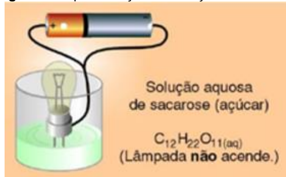
Figura 2: Representação da Solução de sacarose.

Por outro lado, substâncias como a glicerina ou o álcool não conduzem corrente elétrica de forma significativa, pois não se dissociam em íons ao serem dissolvidas (Figura 2). Nessas soluções, a ausência de partículas carregadas impede o fluxo de corrente, caracterizando-as como isolantes (RUSSEL, 1994).