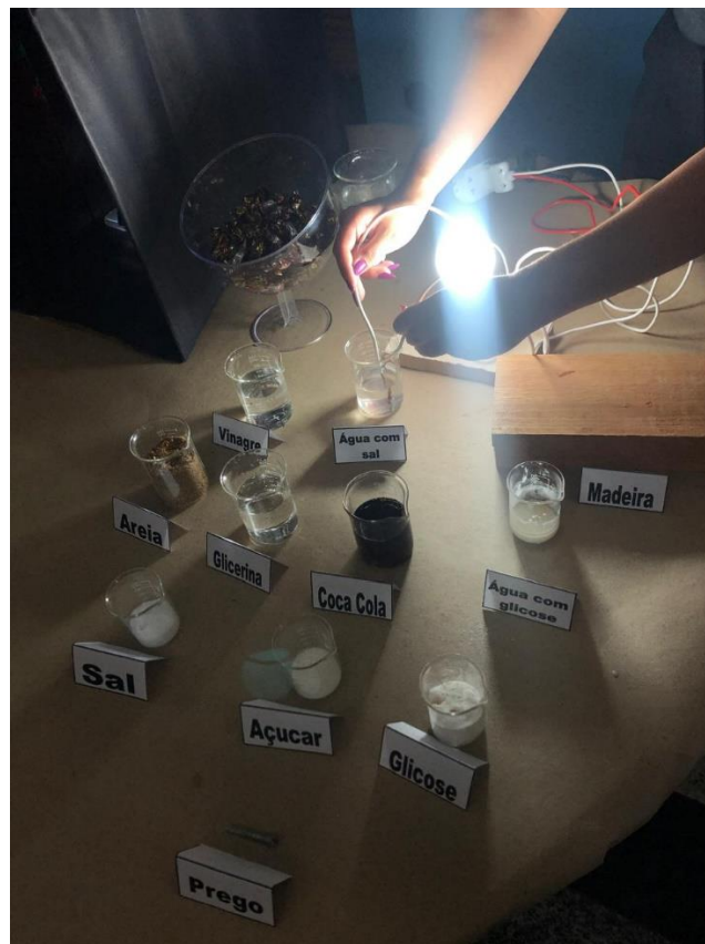
Figura 4: Demonstração de substâncias que conduzem ou não corrente elétrica.

A condução de corrente elétrica em substâncias líquidas, conhecidas como condutores eletrolíticos, ocorre pelo deslocamento de íons positivos e negativos em direções opostas, gerando fluxo de carga. Exemplos claros incluem soluções ácidas, como a Coca-Cola, e salinas, como a água com sal, que demonstraram elevada condutividade elétrica. Em contraste, substâncias como glicerina, areia e madeira, caracterizadas por sua alta resistividade elétrica e baixa condutividade, comportaram-se como isolantes, impedindo o fechamento do circuito e a consequente iluminação da lâmpada.