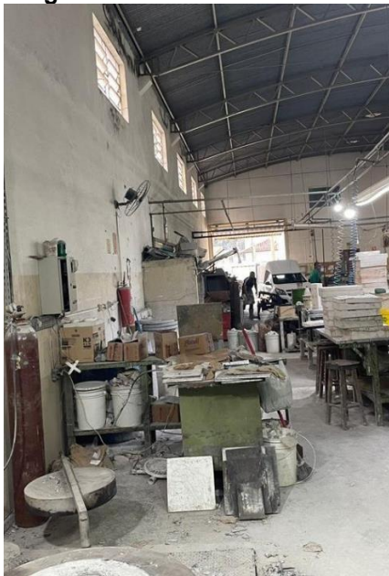
Figura 5 - Materiais desalocados