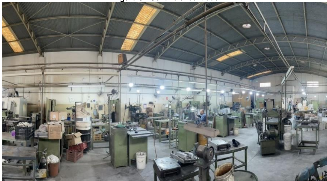
Figura 3 - Cenário encontrado