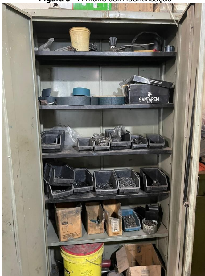
Figura 9 - Armário sem identificação