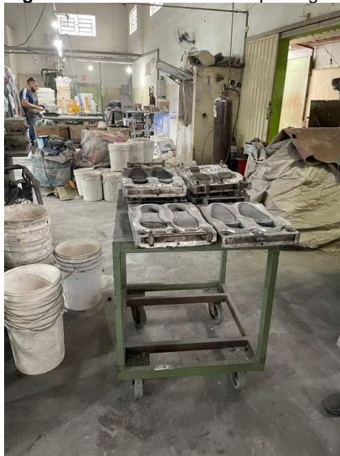
Figura 6 - Baldes obstruindo a passagem