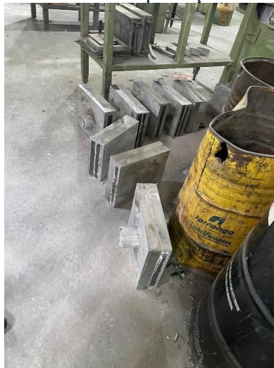
Figura 7 - Materiais de produção desalocados