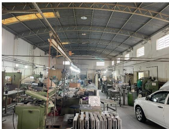
Figura 4 - Visão geral da fábrica