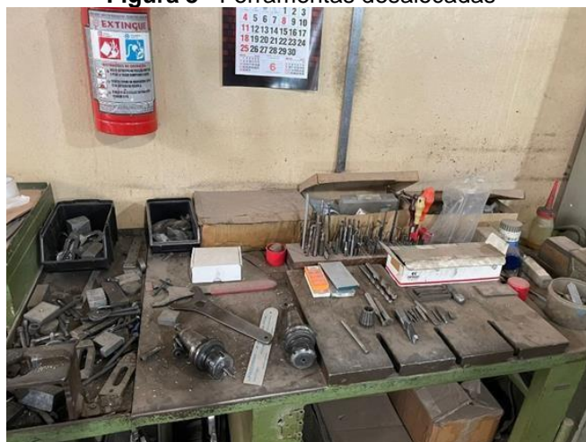
Figura 8 - Ferramentas desalocadas

Devido à falta de um local apropriado para armazenar os utensílios e ferramentas que são utilizados durante o processo, elas ficam espalhadas pela fábrica, no chão ou nas bancadas, podendo ser a causa de possíveis acidentes aos colaboradores, além de reduzir a vida útil destes equipamentos. Abaixo, na Figura 8 é possível observar algumas ferramentas desalocadas.