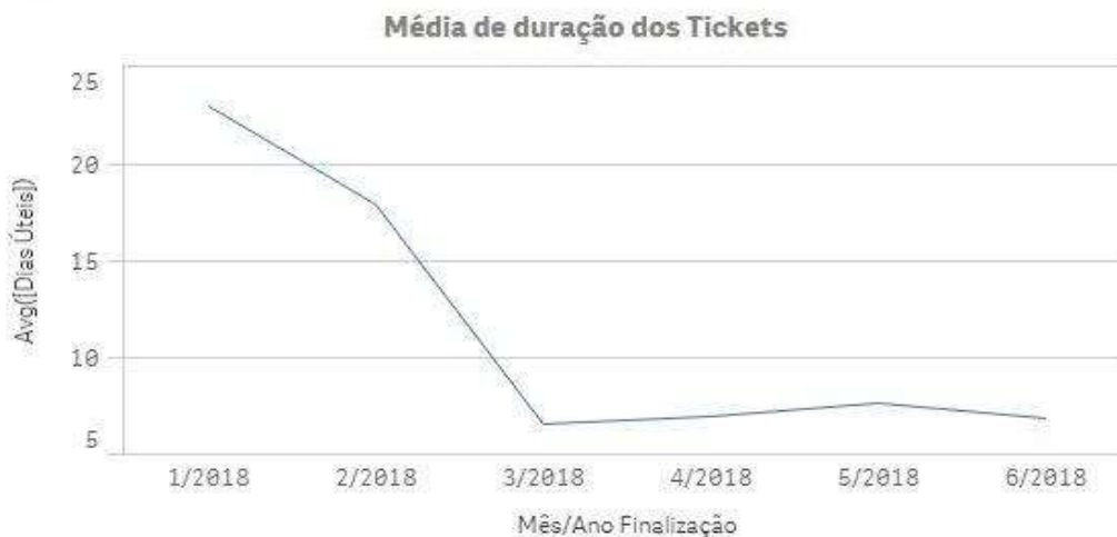
Gráfico 2 - Média de Duração dos Tickets

O gráfico 2 representa o avanço em relação a média de duração dos tickets. Com o projeto foi possível obter maior eficácia e consequentemente o tempo de execução das tarefas diminuiu na média de 70% se comparado ao período de Janeiro de 2018.